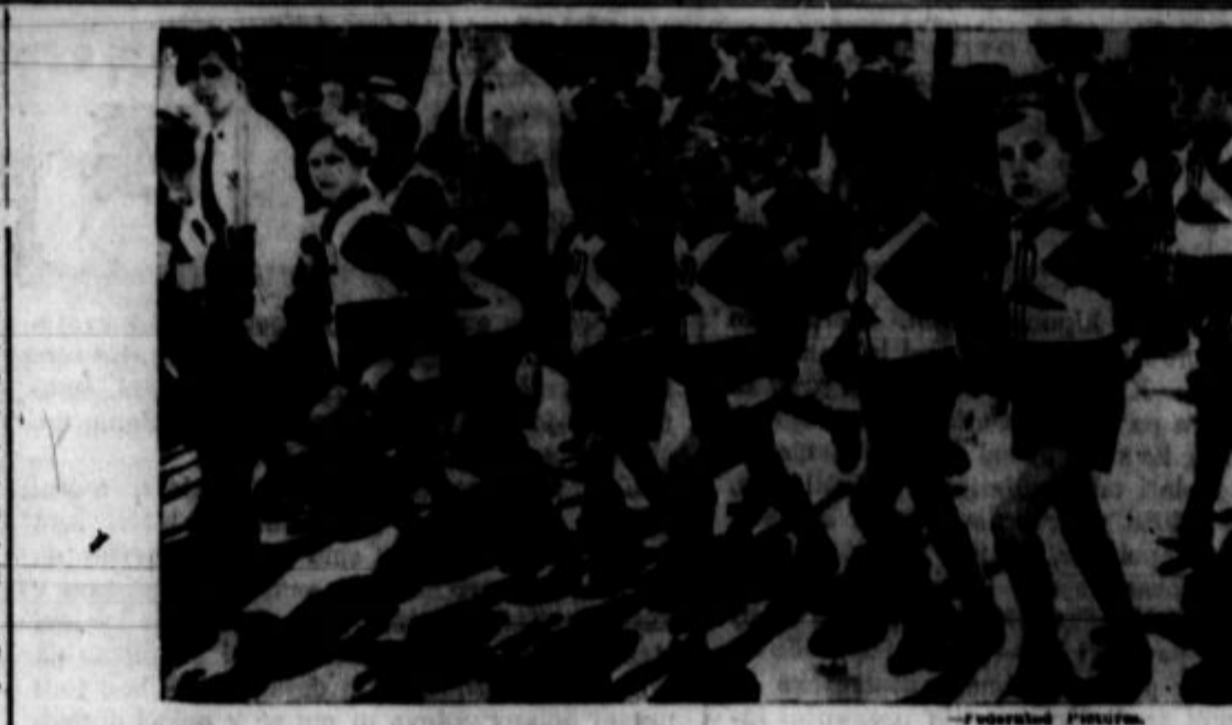
"Sinovi volkulje," člani mladinske fašistične organizacije v Italiji, v pohodu.

Nacijske brutalnosti in perse- kucije delavcev so izzvale sve- tovno bojkotiranje nemškega blaga, kar se je izkazalo za učink- ovito orožje proti Hitlerjevemu režimu.