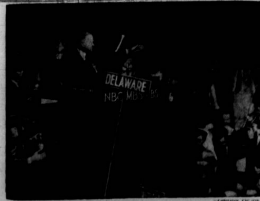
Herbert Hoover, bivši predsednik Združenih držav. Slika ga kaže, ko govori pred delegati republi- kanske konvencije v Clevelandu.

To je odločilo volilni boj. Boj proti 200 magnatom bo pa tudi odločil usodo leve vlade v Fran- ciji, ker vsi Francozi pričakuje- jo od nje, da bo napravila konec umetni nadvladi 200 denarnih mogotcev. — D. P.