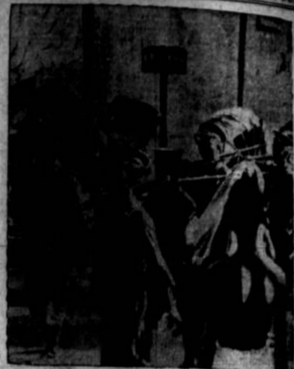
Oddelek kantonskega vojaštva (južna Kitajska) paradira ulicah Kantonu. Vlada južne Kitajske je mobilizirala odpor japonskim militarizmom.

Ker so jih divji kriki privabili, so prišle iz goščave opice pomagat temu nezavestnemu, pobesnelemu bratu, ki je tulil z glasom, v katerem ni bilo že nič več človeškega. Sprva so se obotavljale, kasneje so pa obkrožile Smitha, se stiskale k njemu in mu odgovarjale s