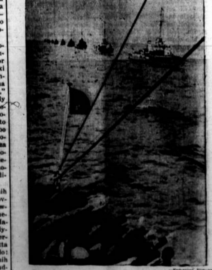
Nemške bojne ladje na manevrih, ki so se vršili ob priliki proslave dvajsetletnice bitke ob Jutlandu.

Mi ne vidimo v Gorkiju boljševika iz zadnjega časa. (Daje je zadnji list.)