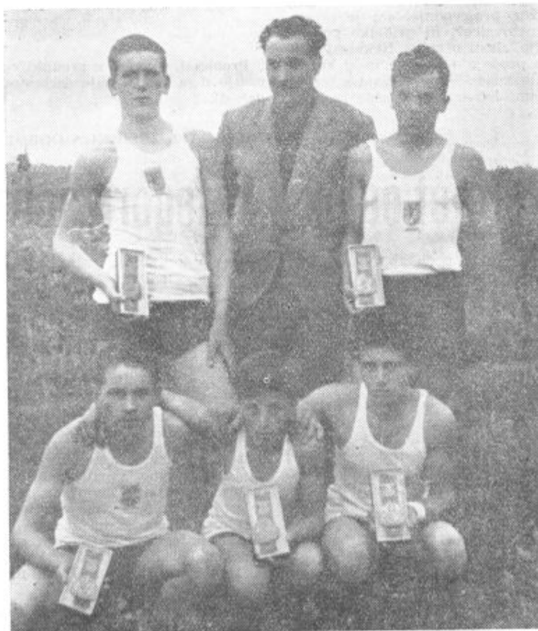
Ekipe, ki je tekmovala na »Pohodu ob žici okupirane Ljubljane«

Kdor je podrobno seznanjen z uspehi, ki jih dosegajo ekipe lenarškega Partizana na različnih (Nadaljevanje na 3. strani)