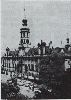
Praga: »Loreta« od 1626 do 1631

V začetku prejšnjega meseca je s Transturistovim avtobusom odpo- tovalo na Češko 44 delavcev iz raz- ličnih OZD z območja občine Ši- ska. Izlet je trajal 5 dni.