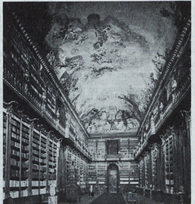
Strahov: »Filozofska dvorana«