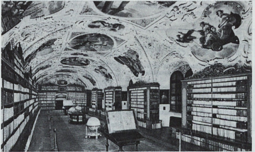
Praga, »teološka dvorana«, knjižnice Strahov

»Vsi, ki smo bili na tem izletu, smo bili s popotovanjem v vseh pogledih prezadovoljni in bomo teh pet dni ohranili v najlepšem spo- minu.«