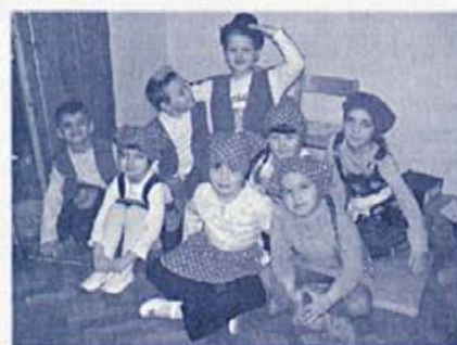
Mladi člani folklorne skupine

17. marec učenci razredne stopnje in otroci dveh skupin vrta so za krajane, predvsem pa za njihove mamice, pripravili prireditev Ta pomlad je nagajiva . S pesmicami, recitacijami in plesom so navdušili svoje starše in prinesli med nas nekaj pomladne živahnosti.