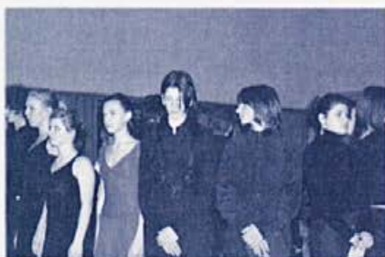
Nastopajoči na prireditvi ob kulturnem prazniku