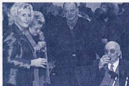
Ob koncu zelo uspele proslave pa še prijeten klepet ob žlahtni kapljici