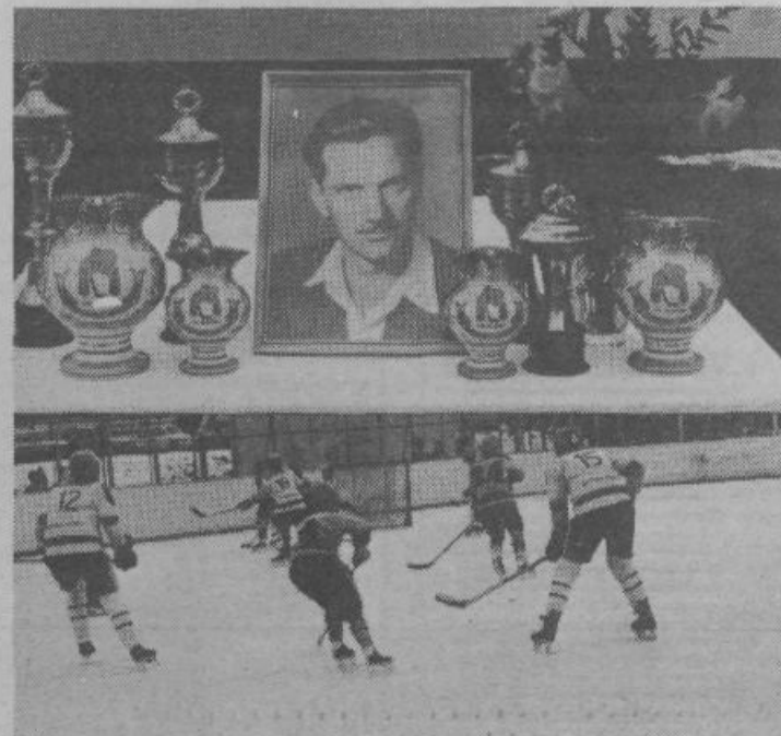
Hudi boji na hokejskem turnirju v Zalogu (Poročamo na 6. strani)