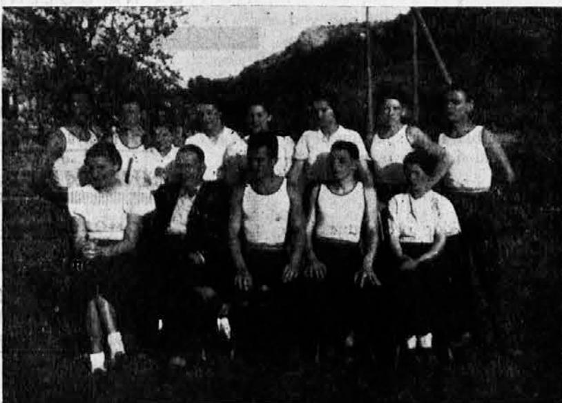
Prednjački tečaj Sokolskog društva Šibenik, održan od 12—23 maja o. g.

Sokolska četa Plavna, učestvovala je dana 30 maja o. g. na javnoj vežbi Bačkoj Palanci koju je vežbu priredilo Sokolskog društva Bačka Palanka. Članovi vežbači ove male čete sudelovali su na ovoj vežbi u svojoj šokačkoj živopisnoj narodnoj nošnji. Na samom sletištu izveli su svoju vežbu u narodnoj nošnji, ostavivši lep utisak na prisutne, a naročito su bili burno pozdravljeni od prisutnih sa tribina, među kojima se toga dana nalazili i g.g. ministri Janković i Stanković. Ova mala četa počela je svoju delatnost tek pre 2 meseca, ali zahvaljujući nastojanju i agilnosti celokupne sokolske uprave uspela je da već na prvom svom koraku pokaže svoju spremnost i volju za budući razvitak sokolske ideje ovde u Plavni. Vredno je napomenuti da ova mala četa ima i svoju duvačku glazbu, koja je također toga dana bila obučena narodnu nošnju i koja je stalno sa sokolskom glazbom iz Bačke Palanke lepo i skladno svirala sve sokolske koračnice za vreme vežbi. — Z. N.