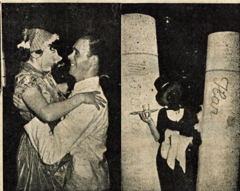
Pa še dve z maskarade v Strazišču — videti je, da je bilo v resnici veselo! Kaj bi ne bilo, saj slavimo Pusta!