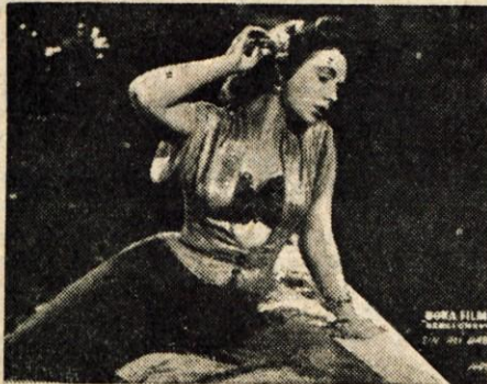
Videli bomo: Amer. film SELINA (spodaj) z Jane Wyman v glavni vlogi in ameriški barvni zabavni film SIN ALI BABE (zgoraj)

Spotoma se je ustavila in krmila. Medtem, ko je kobila jedla, je stopila v prodajalno in si kupila črnega blaga za delovno obleko, naposled pa še kontenine za Uršin predpasnik. Urša dela za sam prežitek, spodobi se, da ji nekaj prinese. Zavoj je bil majhen, toda stričev dvajsetak se je že napol raztopil. Ko je spravljala drobiž, se je jezila na strica.