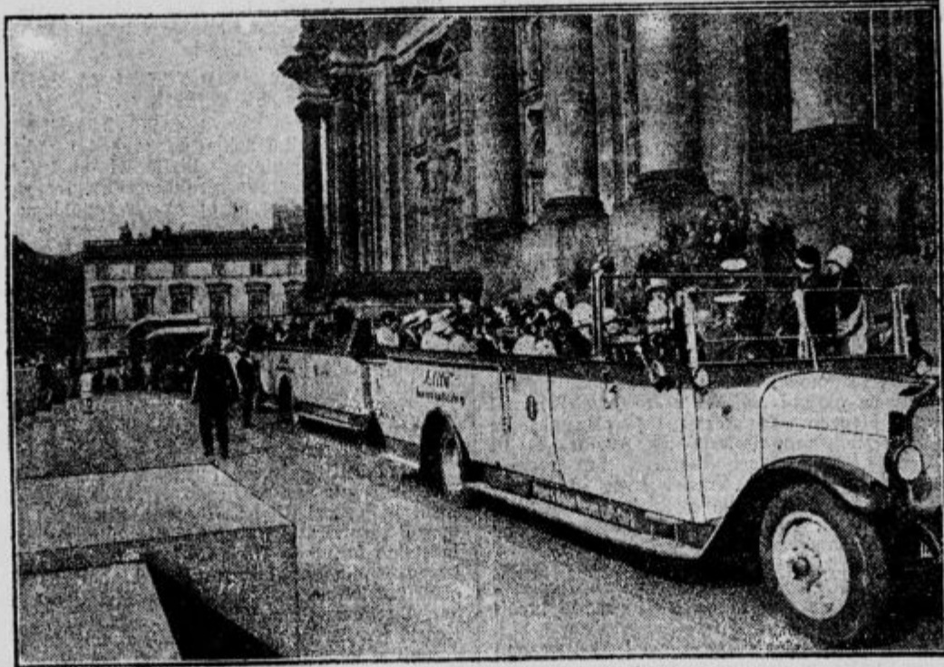
Interparlamentarci v avtomobilih na ogledu po Berlinu.

Neglede na dejstvo, da je bilo med delavstvom opaziti le malo takih, ki bi se jim bila na obrazu brala skrb in utrujenost, smo ugotovili, da je velik del vseh 130.000 delavcev