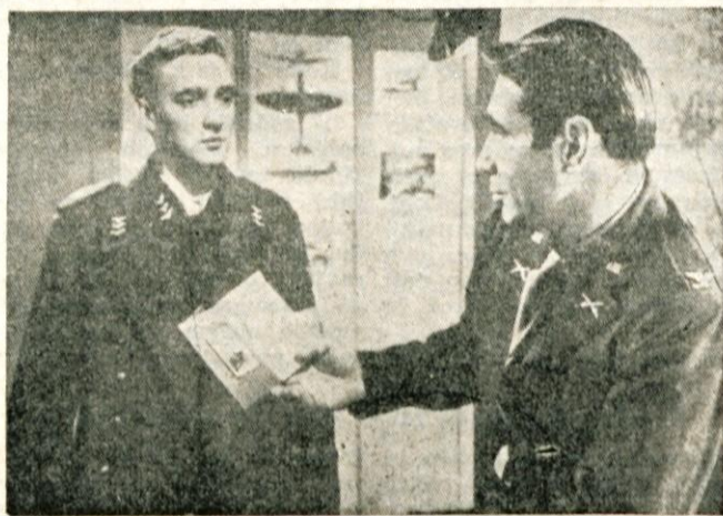
Prizor iz filma „Odločitev pred zoro“

Čeprav je film ameriški, v njem nastopajo samo nemški igralci, ker je snov vzeta iz preteklega vojne in se dejanje vrši v Nemčiji. Naslov filma je »Odločitev pred zoro«. Vsebinska je v kratkem ta-le: Mlad