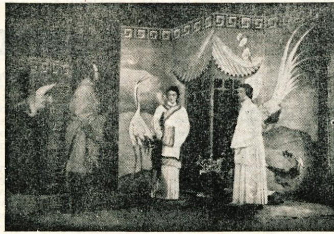
Prizor iz Klabundovega »Kroga s kredo« v Kranju

V počastitev obletnice Prešernove smrti je delavsko kulturno društvo »Svoboda« pripravilo skupno s tovarno »Vat« na Viru in tovarno papirja in lepenke na Količevem proslavo, kateri je prisostvovalo mnogo domačinov in ljudi iz bližnje in daljne okolice. Umetniški program je bil pester in je obsegal poleg življenjepisa o dr. Francetu Prešernu še pevske točke, deklaracije in zbornice recitacije.