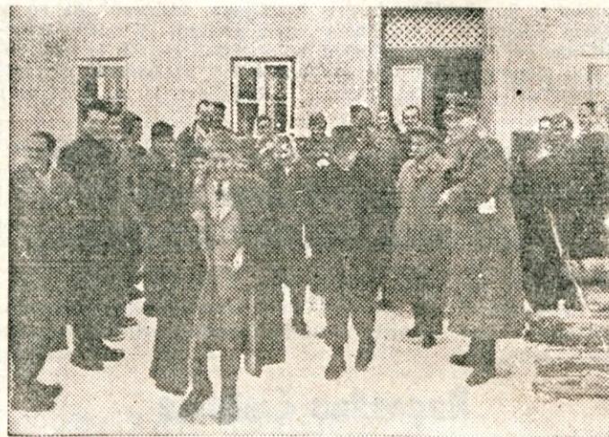
Po obisku v Šoli pri Sv. Ani