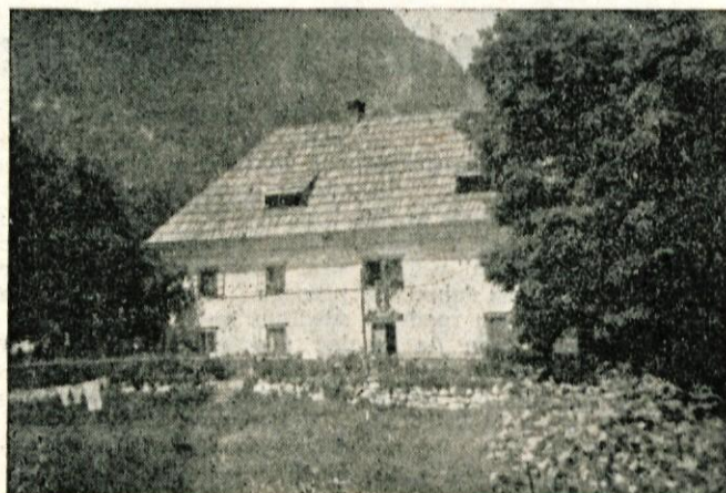
Bivša Zojsova graščina — sedaj tehniški muzej

Razvaline te stare topilnice ob Plavčevki je v stoletjih prerasló grmovje, dreve in mah. Pa tudi Plavčevka, ki teče mimo razvalin je v teku časa opravila svoje. Odborniki tehniškega muzeja in člani društva inženirjev in tehnikov v Jesenic, so si ogledali vso stvar na licu mesta in ugotovili, da je treba razvaline nekdanje topilnice takoj zavarovati pred nadaljnjim razpadanjem, kot so v minulih letih razpadle fužine v Bohinjski Bistrici, Stari Fužini, Spodnji Radovni, na Plavžu, v Mojstrani, na Stari Savi, v Trebežu in v Mostah. Pred 50 leti je še obratovala fužina v Spodnji Radovni, v kateri je bilo zaposlenih 25 fužinskih