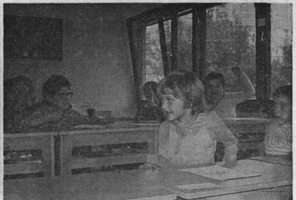
Zadnji dokončani objekt samoprispevka I za Bežigradom — osn. šola Borisa Ziherla

smo v prvem prispevku dobili šolo, telovadnico ter igrišče v Dolu. Takrat so drugi občani solidarno nam odstopili svoj prispevek, tokrat pa bomo mi solidarno prispevali svoj denar drugim krajevnim skupnostim. Zavedamo se, če uspešno rešimo najbolj kritične probleme, bomo kasneje lahko enotno reševali tudi nekoliko manjše, ki pa so za posameznika, ki je prizadet, lahko veliki že danes. Beričevci vam zagotavljamo, da se bomo 21. novembra polnoštevilno udeležili glasovanja za novi samoprispevek in bomo glasovali »ZA«!