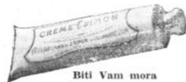
Biti Vam mora vedno pri roki!

Sonce lahko poškoduje Vaše oči. Zato jih zaščitite. Toda sonce povzroča tudi boleče opekline, od katerih dobi koža predvsem starejši izgled. Kadar te opekline izginejo, postane koža grda in nagubana. Če torej želite, da Vaša koža potemni brez sončnih opeklin in da očuva svežino in mladosten izgled, uporabljajte vsekakor prepotrebno