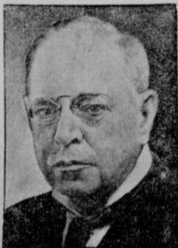
John Philip Sousa, najznamenitejši ameriški komponist, je umrl star 77 let. Komponiral je številne marše, ameriško narodno himno. Imenovali so ga »ameriškega Straussa«.

Po večletnih pripravah so pričeli nedavno graditi veliko železnico preko saharške puščave. Od Dahomeja v francoski zahodni Afriki bo šla železnica preko ogromne puščave v Alžir in Oran ob sredozemski obali. S pomočjo te železnice bo v bodoče mogoče pripeljati vojaštvo iz osrednje Afrike v treh dneh do sredozemske obale in od tam naravnost v Francijo. S tem se je izpolnila nujna zahteva francoskih strategov. Železnica bo stala več sto milijonov frankov. Železnica bo tekla po obširnih puščavah, kamenitih in peščenih pokrajinah, kamor še ni stopila človeška noga, zopet drugod bo zgrajena preko strmih gorskih grebenov. Gradili bodo zelo hitro in upajo, da bo to ogromno in težavno delo končano v dveh letih.