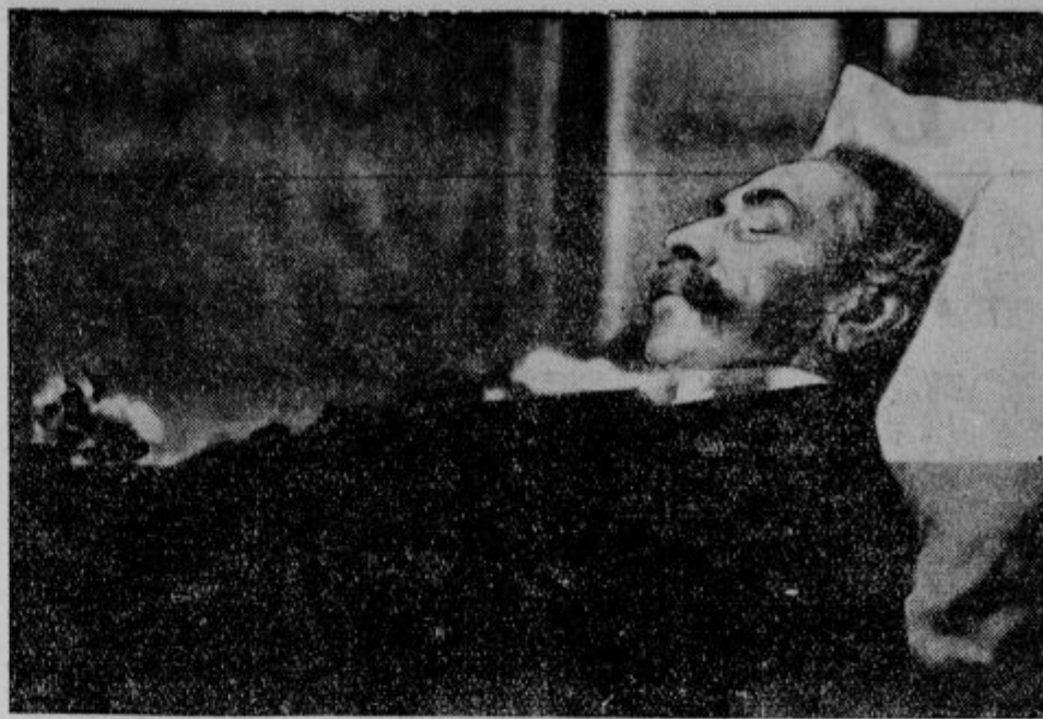
Briand na mrtvaškem odru.

Moderno poganstvo (60 milijonov), brezposelnost (10 milijonov) in strah za stanovitnost so križi, ki morejo ogroziti tudi ameriško katoličanstvo. Sreča, da je še močno in mlado!