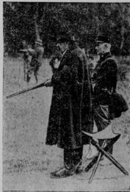
Briand na lovu. Največja zabava in strast pokojnega državnika je bila lov na divje rase.