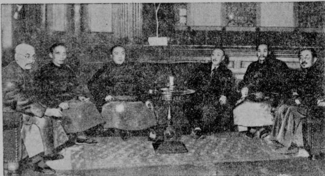
Ustanovitelji mandžurske republike.

V poslednjem izdanju knjige o narodnem blagostanju Amerike čitamo zanimive podatke o stanju v l. 1930. Na vsako ameriško rodbino je v tem letu prišlo povprečno 10.961 dolarjev (ca 600.000 Din) narodnega premoženja in 2.366 dolarjev letnega narodnega dohodka. Na posameznega prebivalca je prišlo torej 2677 dolarjev (ca 150.000 Din) narodnega premoženja in 578 dolarjev (ca 32.000 Din) dohodkov.