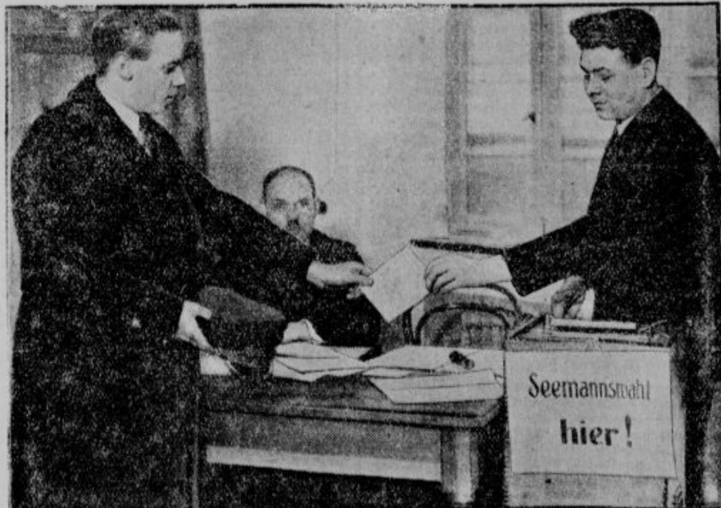
Mornarji volijo. 13. t. m. bo nemški narod volil predsednika države. Po zakonu pa so v nemških pristaniščih pričeli z volitvami že 7. t. m. Volijo lahko vsi oni pomorščaki, ki dokažejo, da se njihova ladja 13. t. m. ne bo nahajala v nobeni nemški luki.