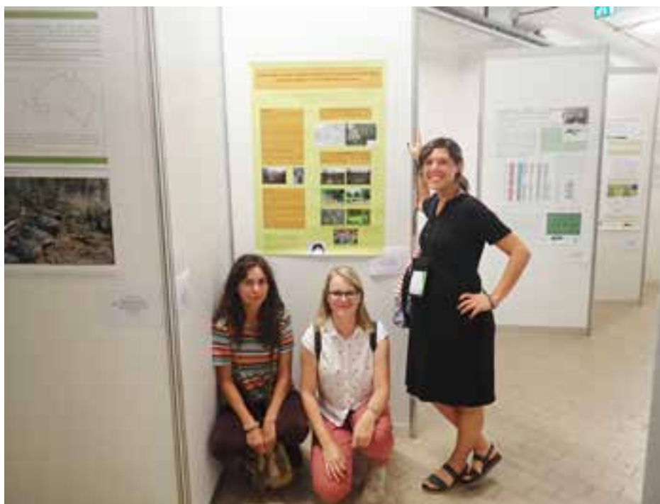
Slovenske herpetologinje pred plakatom na Evropskem herpetološkem kongresu v Milanu.

Med kongresom smo sodelovali na predstavitvi plakatov in poslušali veliko zanimivih predavanj. Udeležili smo se tudi nekaterih drugih organiziranih dejavnosti, ki so bile bolj družabnega značaja. Kongres je bil zelo dobro obiskan, s skoraj 300 udeleženci, in je predstavljal odlično priložnost za navezovanje mednarodnih stikov s kolegi herpetologi. ✨