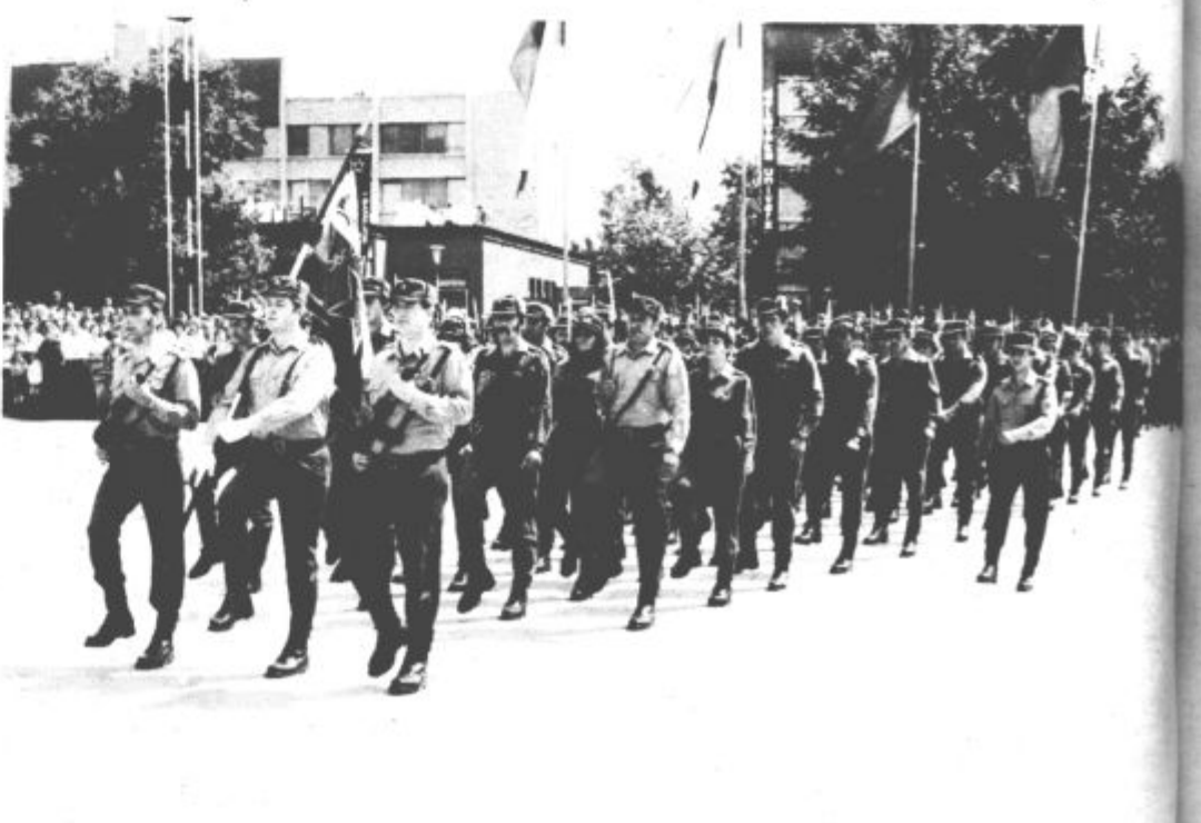
Enote teritorialne obrambe