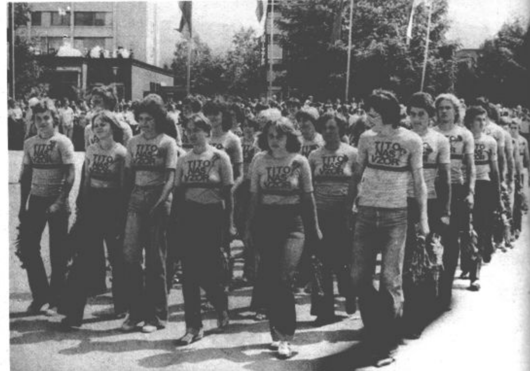
Tudi takole so udeleženci parade izrazili ljubezen do tovariša Tita