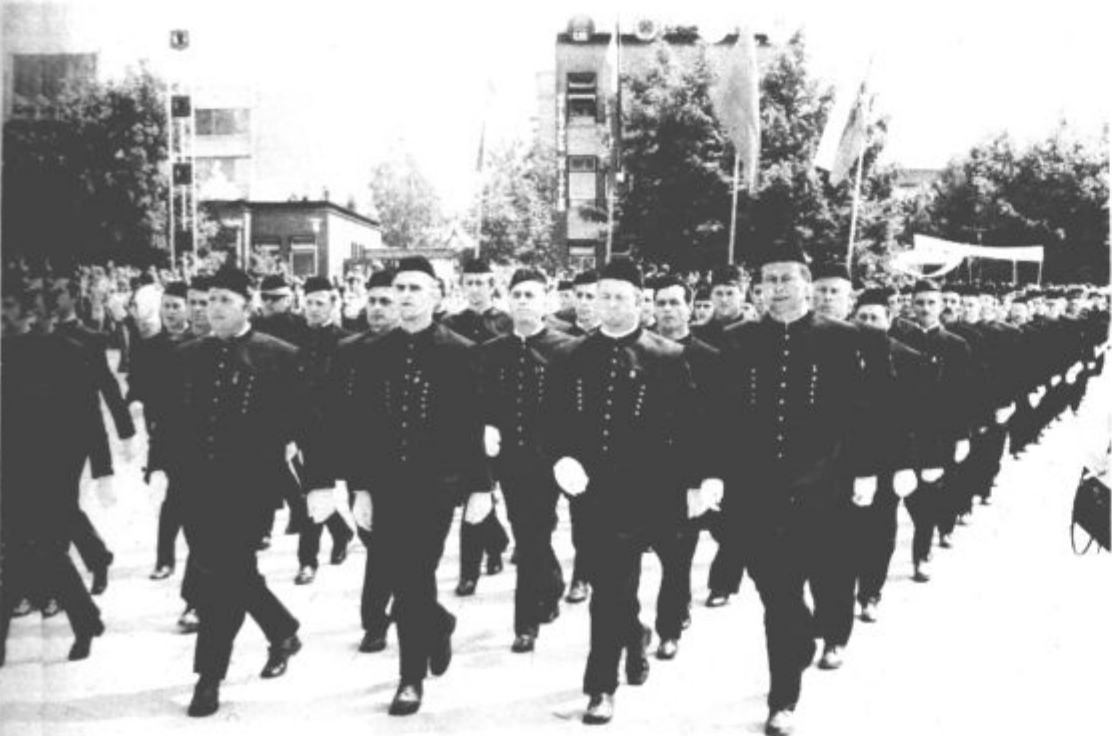
Rudarji v svečanih oblačilih