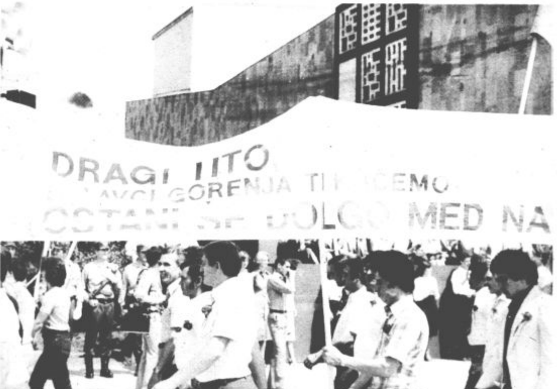
Mnogi so nosili gesla z napisi ljubezni in pripadnosti tovarišu Titu