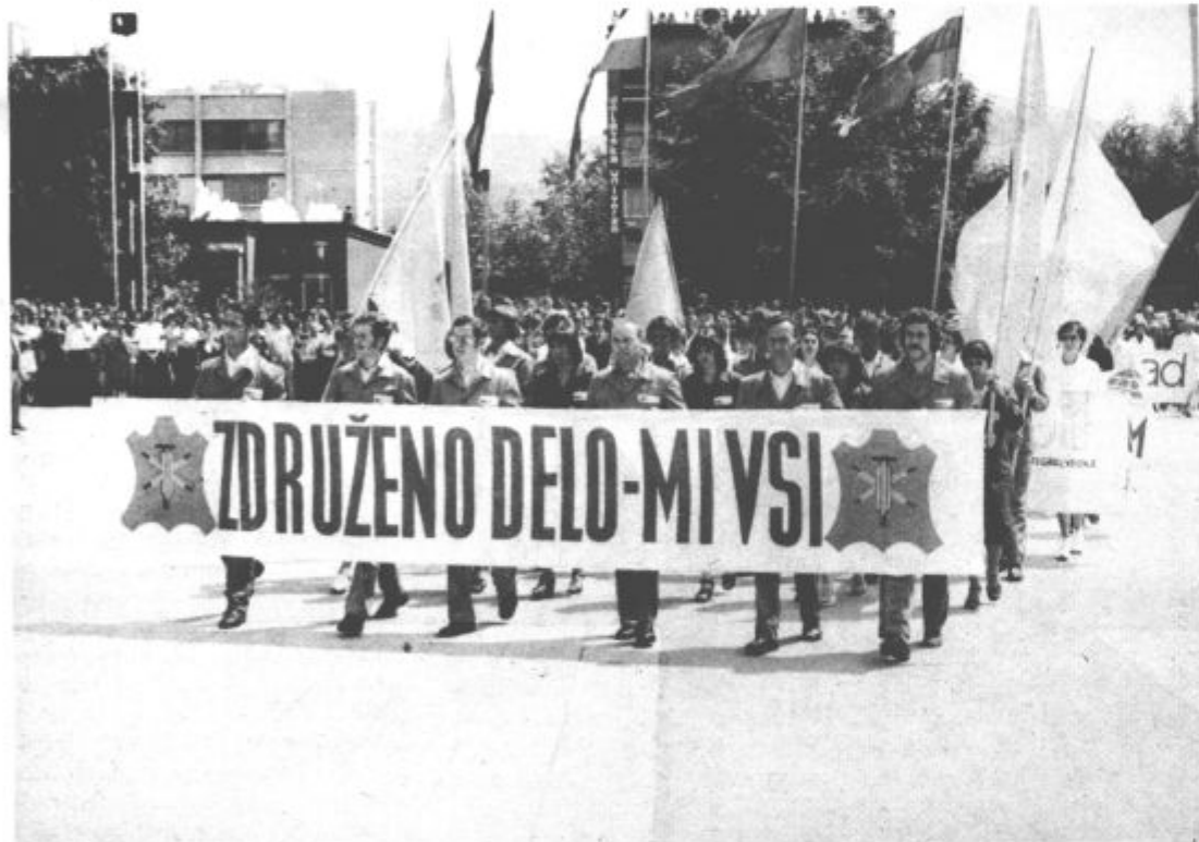
V dveh ešalonih so bili v paradi predstavniki drugih delovnih kolektivov občine

he, šoštanski ribiči pa so na mednarodnem tekmovanju v Varni z uspehom zastopali Jugoslavijo. Lovci, ki so organizirani v 5 družinah, pa gospodarijo z 22.000 ha zemljišč. V lovski vrste je včlanjenih skoraj 300 članov, ki se aktivno vključujejo v delo za ohranjanje naravnega okolja. Vse pomembnejše postaja delo na področju splošne ljudske obrambe in družbene samozaščite. Ob letošnjih jubilejih je prejela lovška družina Škale red zaslug za lovstvo II. stopnje.