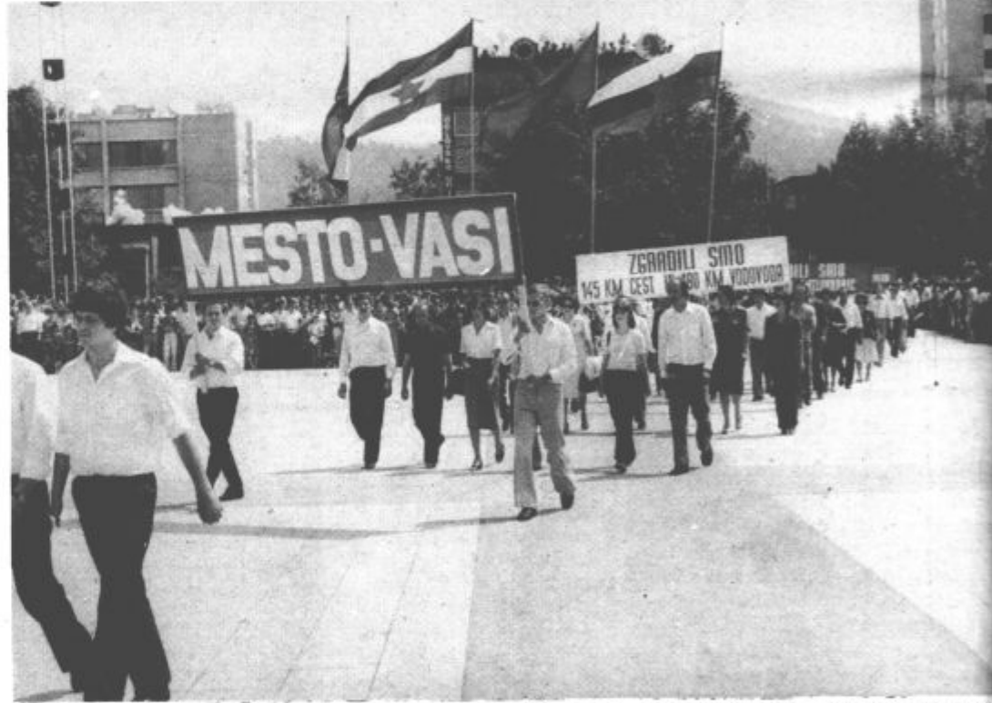
Predstavniki krajevnih skupnosti so znova poudarili pomen gesla Mesto-vasi, pod katerim so bile zgrajene domala vse ceste, ki povezujejo mestne in vaške krajevne skupnosti