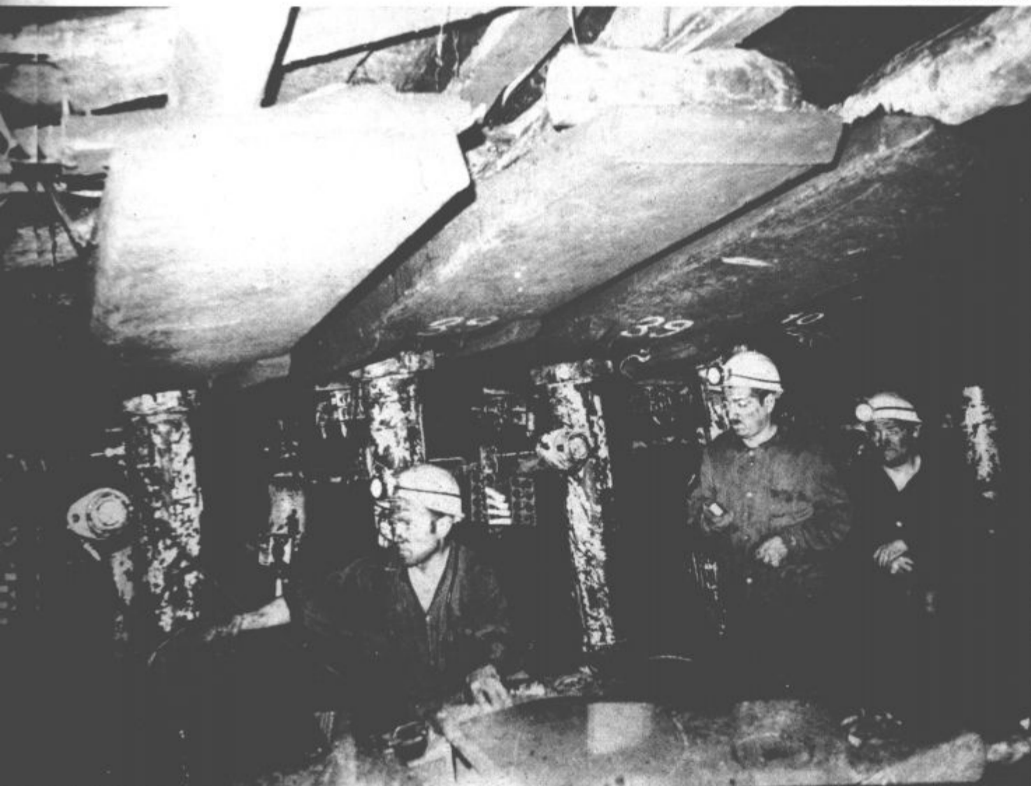
Globoko pod zemljo