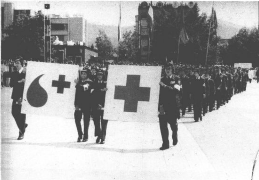
Pripadniki civilne zaštite