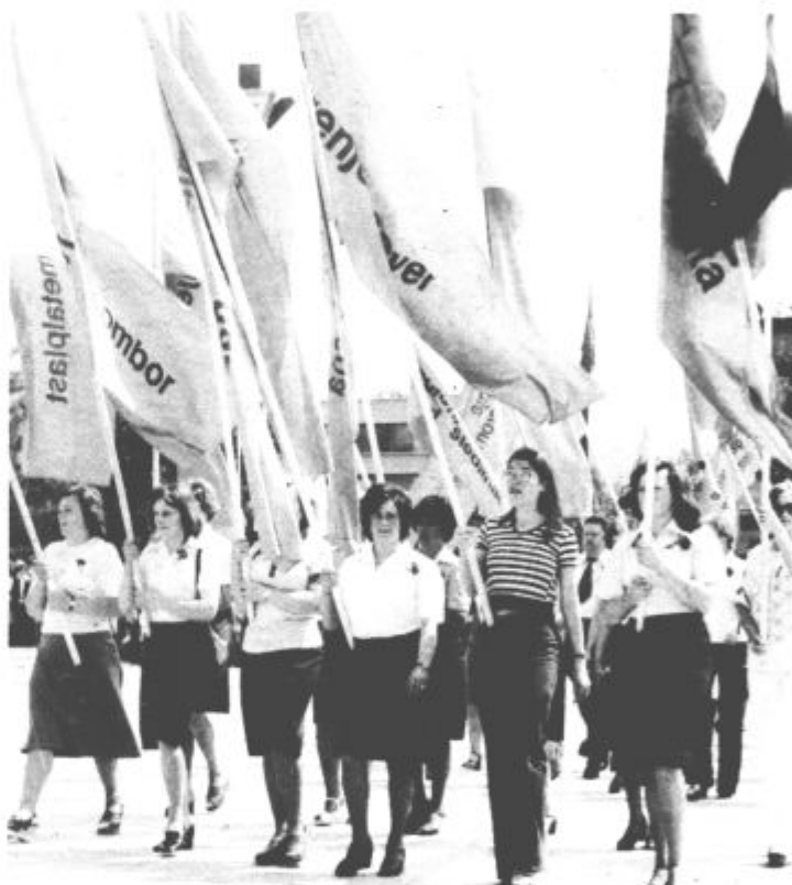
Delegati Gorenja v sprevodu so predstavljali 17.000 članski delovni kolektiv Gorenja

V drugem ešalonu so bili delegati trgovskih in gostinskih delovnih organizacij, pa predstavniki podjetja za vzdrževanje hiš DOM, komunalno obrtnega centra, gradbenega industrijskega podjetja Vegrad, ki slavi letos 20-letnico obstoja in ki se vključuje v praznovanje letošnjih jubilejev s pomembno delovno zmago – z odprtjem tovarne celice, skupaj z Gorenjem pa uresničujejo program industrializacije gradbeništva. V sprevodu pa so bili tudi delavci podjetja za distribucijo toplote Toplovod Velenje.