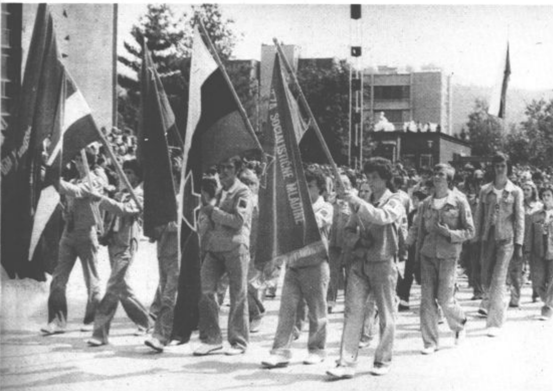
Z zastavami delovnih zmag so v sprevodu ponosno korakali brigadirji

terre so vključeni tudi mladi iz naše občine.