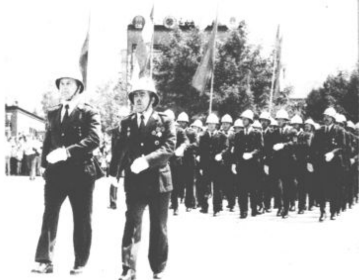
Tudi gasilci so strumno korakali mimo slavnostne tribune

Od vsepovsod, iz vseh temeljnih organizacij združenega dela Gorenje, iz predstavništev in servisnih centrov širom po Jugoslaviji, so prišli delegati na sobotno slavo. Delegati Gorenja so prinesli pozdrave in čestitke vsem velenjskim delovnim ljudem in občanom, ki so lahko znova na praznični dan s ponosom ugotavljali rezultate svojega dela ter s tem dokazali, koliko in kaj se da zgraditi in narediti v naši socialistični skupnosti.