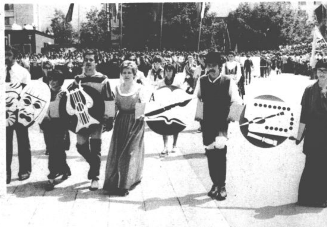
Kulturno življenje je v občini zelo razvejano