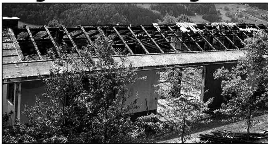
Požar je v celoti uničil ostrešje, vso krmo in nekaj manjših kmetijskih strojev.