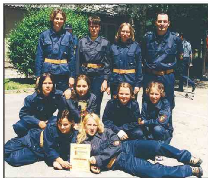
Mladinke PGD Lokovica