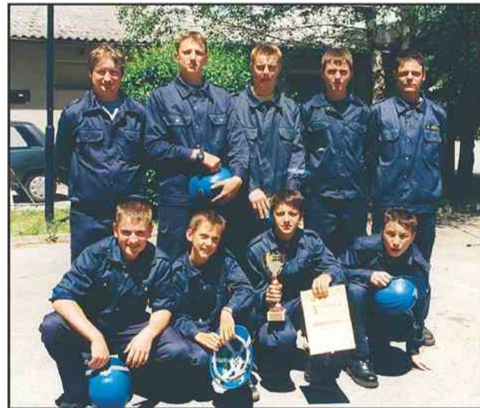
Mladinci PGD Paška vas