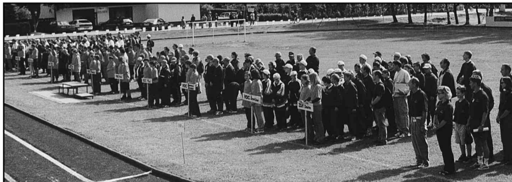
Med slovesno otvoritvijo iger