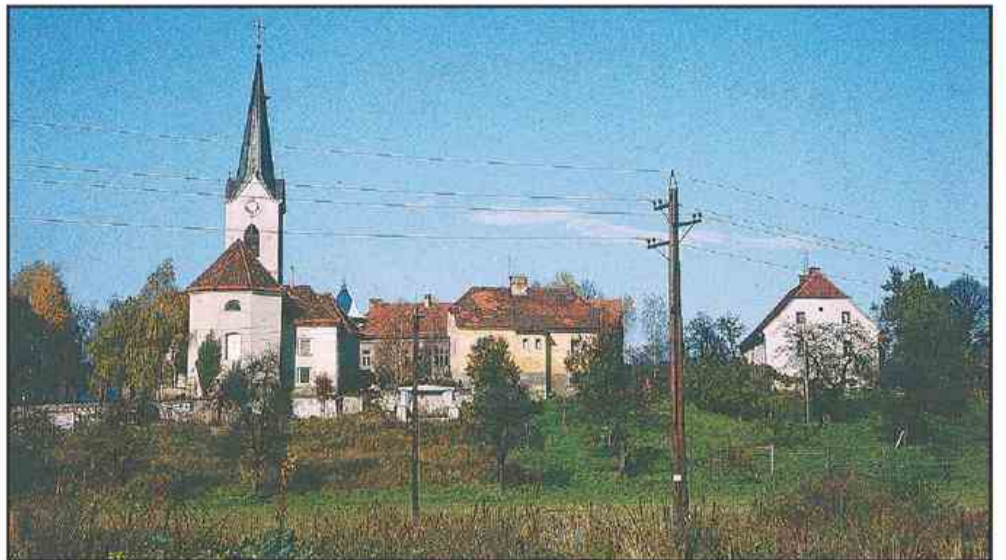
Cerkev sv. Mihaela v Družmirju