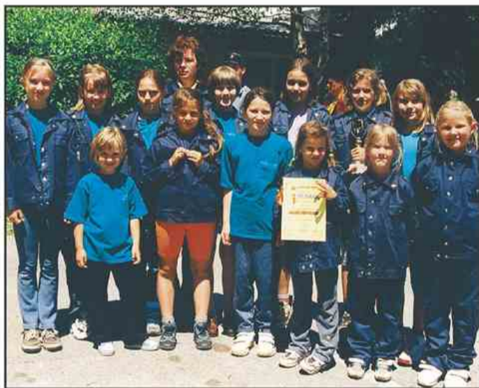
Pionirke PGD Topolšica