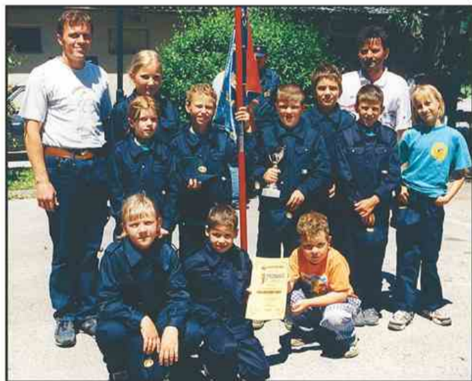
Pionirji PGD Bevče