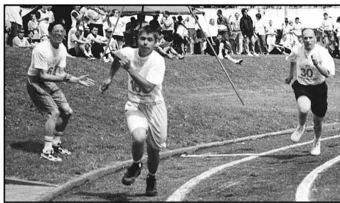
Športna vema brez primere