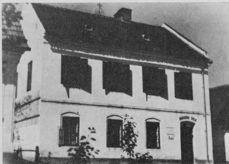
Vitomarci (Sv. Andraž v Slovenskih goricah), šola, zgrajena leta 1864, dozidana 1888 in popravljena 1894

nosti njenih, še ne ponemčenih slovanskih pokrajin s pospeševanjem germanizatorskih in fiskalnih izboljšav in interesov. Ta razsvetljenski Kumerdejev načrt imenuje Edvard Kardelj (Sperans) v svoji zgodovinski knjigi o našem narodu 10 »eno najzgodnejših zavednih političnih manifestacij slovenskega narodnega gibanja po Trubarjevi Cerkovni ordningi (1664)« v naši književnosti. Kumerdejev je znal že v uvodu te spomenice kot v celoti cesaričino »materinsko milost« obrniti svojemu narodu v prid in je opozoril kot Vodnik na »najpravo lego« naše dežele, ki »je za trgovanje zelo primerna, ljudje pa so delavni, obdarjeni z dobrimi lastnostmi uma in srca, a živijo v največji revščini, tako da komaj zmorejo plačevati deželne in druge dajatve.« »V vojaški službi pa se da z njimi malo doseči, ker sodijo, da je ta stan največje zlo. Ne ravna se po najvišjih odlokih, ker jim ostajajo večinoma neznani in so končno že po naravi izločeni od vsakega koristnega občevanja s sosednjimi ljudstvi, ker govorijo jezik, ki je samo njihov.«