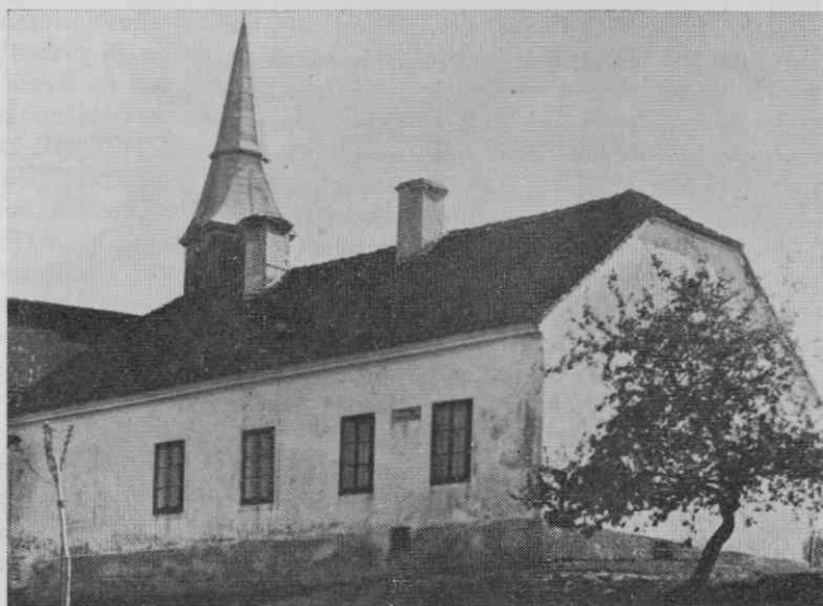
Gornji Petrovci (1869)

Tudi vsa glavarstva so se večinoma negativno izrazila o Kumerdejevem načrtu. Sklicevala so se na pomanjkanje sredstev, pri-