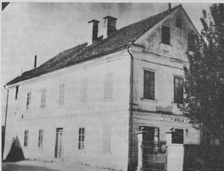
Lovrenc na Dravskem polju, zgrajena leta 1879 (dve učilnici in stanovanje za upravitelja)