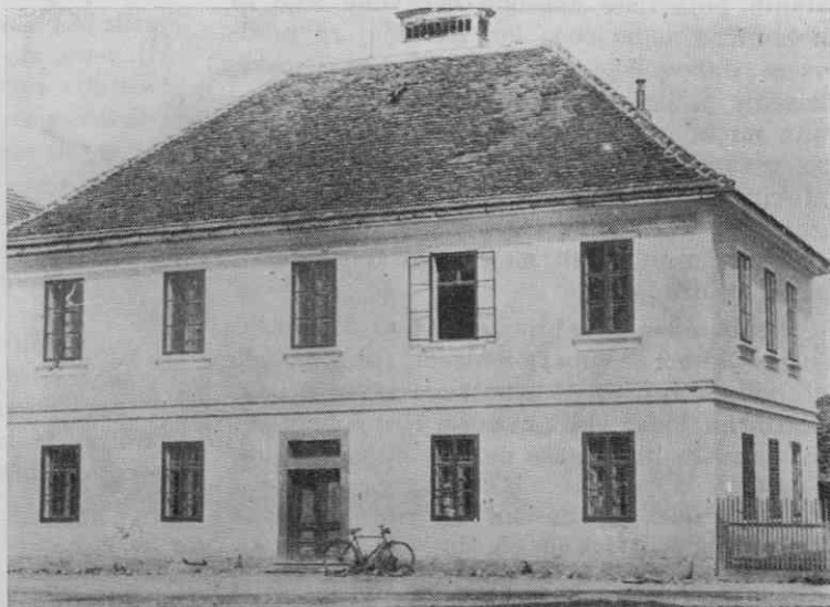
Gorišnica (Marjeta pri Ptuj), šolsko poslopje, zgrajeno leta 1821, prežidano leta 1891

Tudi odnos do šole se je v teh dveh stoletjih močno spreminjal in stopnjeval. Prodor človečanske misli, prodor ideje o enakosti, bratstvu in svobodi vseh ljudi in narodnosti, ki je bruhnila v svet, je postopno razbil v demokratični smeri fevdalne okove nekdanje družbene ureditve in posplošil izobraževanje najširših ljudskih plasti. Za zmago splošne uvedbe osnovnega ljudskega izobraževanja sicer ni bila potrebna kaka krvava žrtev, tem-