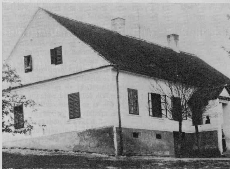
Markovci, stavba, zgrajena leta 1812, a obnovljena leta 1890

Cesarica Marija Terezija je pod vplivom vzgojnoizobraževalnih idej v Evropi sredi druge polovice 18. stoletja, ki jih je delno pobudila Komenskega Didaktika magna, vztrajno in toliko časa naglašala zahtevo, da je treba podložnike pobližje seznaniti predvsem z dolžnostmi do države in državljanom pomagati, da bodo bolje gospodarili in lažje plačevali davke. Hotela je z gmotnim in umskim napredkom ljudstva izboljšati stanje državnega