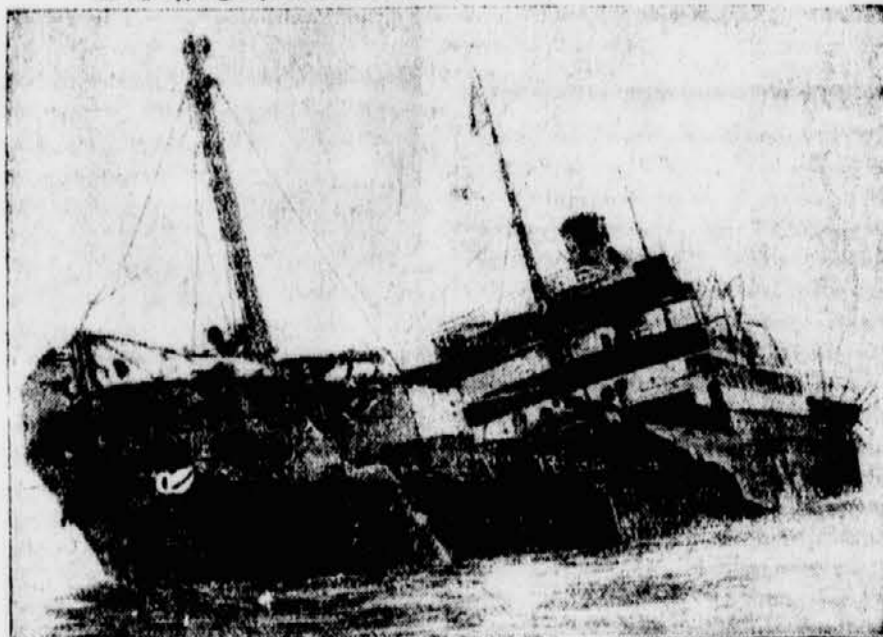
Auf der Themse stieß bei dichtem Nebel der japanische Dampfer „Kakone Maru“ mit dem norwegischen Dampfer „Erling Lindoe“ zusammen. Der norwegische Dampfer erlitt so schwere Beschädigungen, daß er auf Grund gesetzt werden mußte. Unser Bild zeigt den norwegischen Dampfer „Erling Lindoe“ nach dem Zusammenstoß.