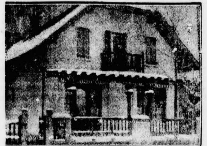
Die Villa „Des Argenteo“ in Servoz, in der sich Stabisky aufhielt, bevor er nach Chamonijs flüchtete.