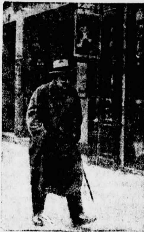
Der Deputierte und Bürgermeister von Pannon, Garat, wurde in Haft genommen.