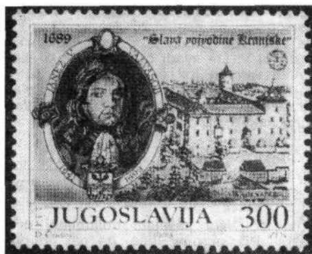
Znamka, ki je izšla ob letošnji 300-letnici Valvasorjeve Slave

Vojvodina Kranjska je v Valvasorjevem času obsegala približno isto ozemlje kot današnja republika Slovenija brez Stajerske, Prekmurja in Goriške, k njej pa je spadal osrednji del Istre do Reke, torej pretežno del Slovenije, kjer srečamo kras in kraške pojave. Valvasor o sebi pravi: »Priznam brez nečimrnega slavohlepja in brez precenjevanja samega sebe, da me je kot ljubitelja vseh svobodnih in naravnih umetnosti moj živ dan radovednost ali vedoželjnost izpodbadala k raziskovanju naravnih redkosti in skrivnosti. Kjerkoli sem mogel izvedeti za vedoželjnega moža, tja sem se napotil in nobena pot mi ni bila predolga, nobena nevarnost prevelika, noben trud prenaporen; upanje, da se utegnem česa nenavadnega naučiti in kaj takega zvedeti, mi je slajšalo vse bridkosti. Gola vedečnost me je vodila ne le po