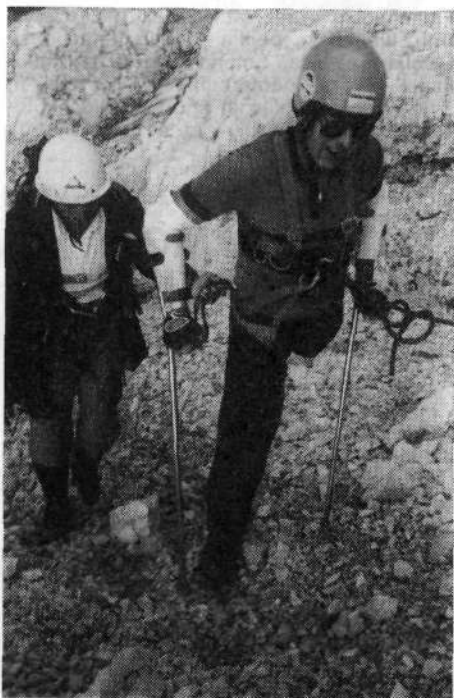
Ponekod je bilo mogoče hoditi z obema berglama...