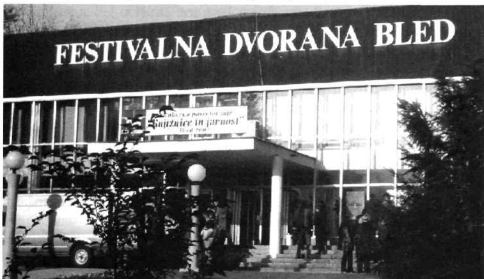
Slika 2: Posvetovanje ZBDS na Bledu (2002)