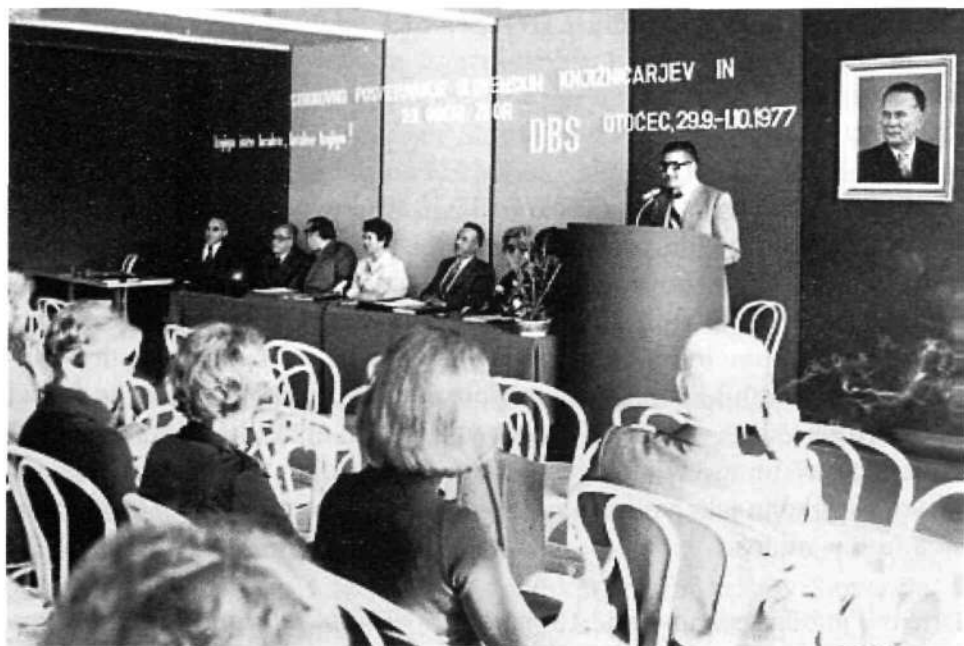
Slika 1: Posvetovanje ZBDS "Bralec išče knjigo, knjiga išče bralca", Otočec, 1977

Člani so dejavni v organih in sekcijah ZBDS. V tridesetih letih svojega delovanja je društvo sodelovalo pri soorganizaciji štirih strokovnih posvetovanj, ki jih je organizirala ZBDS. Leta 1977 je bilo na Otočcu posvetovanje z naslovom "Bralec išče knjigo, knjiga išče bralca", leta 1988 v Novem mestu, z naslovom "Zapisi znanja v informacijski dobi". V Termah Čatež je bilo leta 1996 dvodnevno posvetovanje na temo "Knjižnica in njeni uporabniki", leta 2003 pa ponovno na Otočcu z naslovom "Vizija razvoja knjižničarstva v Sloveniji".