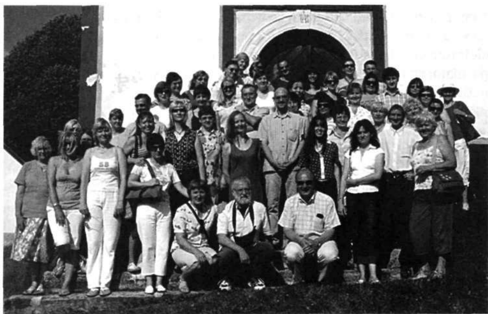
Slika 1: Srečanje članov DBC, Tinsko Šmarje pri Jelšah, 21. junija 2007