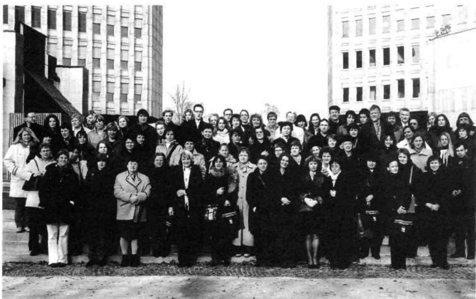
Slika 2: Tradicionalno slikanje ob zaključku posvetovanja (Ljubljana, 18. - 19. november 2004)

Uradna jezika posvetovanja sta slovenščina in angleščina. Mednarodni okvir dogajanja pa zaznamujejo, tako vabljeni gosti iz Evropske skupnosti mag. Lars Bjornshauge, direktor knjižnic na Univerzi v Lundu na Švedskem, in gospa Ingeborg Stoltzenburg, vodje knjižnice v Evropski centralni banki, kot tudi predstavitve najnovejših dosežkov tujih založnikov. Strokovni del programa je popestren z družabnim in kulturnim dogajanjem. Predavanja pa so tematsko dopolnjena s forumom dobrih praks in dvema okroglima mizama o konzorcijskem povezovanju in statusni problematiki.