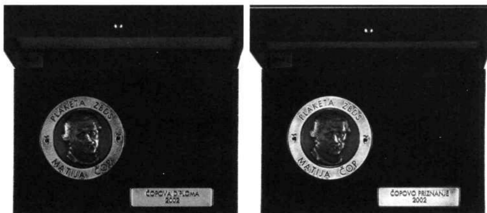
Slika 1: Podoba Čopovih plaket

Čopova diploma in priznanje se podeljujeta na osnovi razpisa, ki je vsako leto objavljen v publikacijah (tudi elektronskih) ZBDS in razposlan predsedstvom področnih bibliotekarskih društev. Pogoji za pridobitev Čopove diplome oziroma priznanja so opredeljeni v Pravilniku o podeljevanju Čopovih diplom.