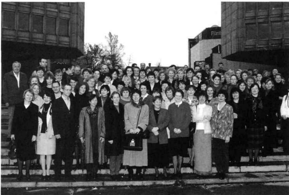
Slika 1: Udeleženci posvetovanja, zbrani na ploščadi pred poslovno stavbo TR3 v Ljubljani (16. - 17. novembra., 2000)

šesto posvetovanje (1996) pa je posvečeno organizacijskim, tehnološkim in komunikacijskim izzivom. Naslednja posvetovanja zaradi organizacijskih sprememb v matični službi za področje specialnih knjižnic, potekajo pod okriljem NUK. Na sedmem posvetovanju (1998) se tematika preusmeri k informacijski tehnologiji in njeni uporabi v specialnih knjižnicah; osmo posvetovanje (2000) pa ponovno obravnava bolj klasično bibliotekarsko tematiko kot je izgradnja knjižničnih zbirk ter pridobivanje in izločanje gradiva.