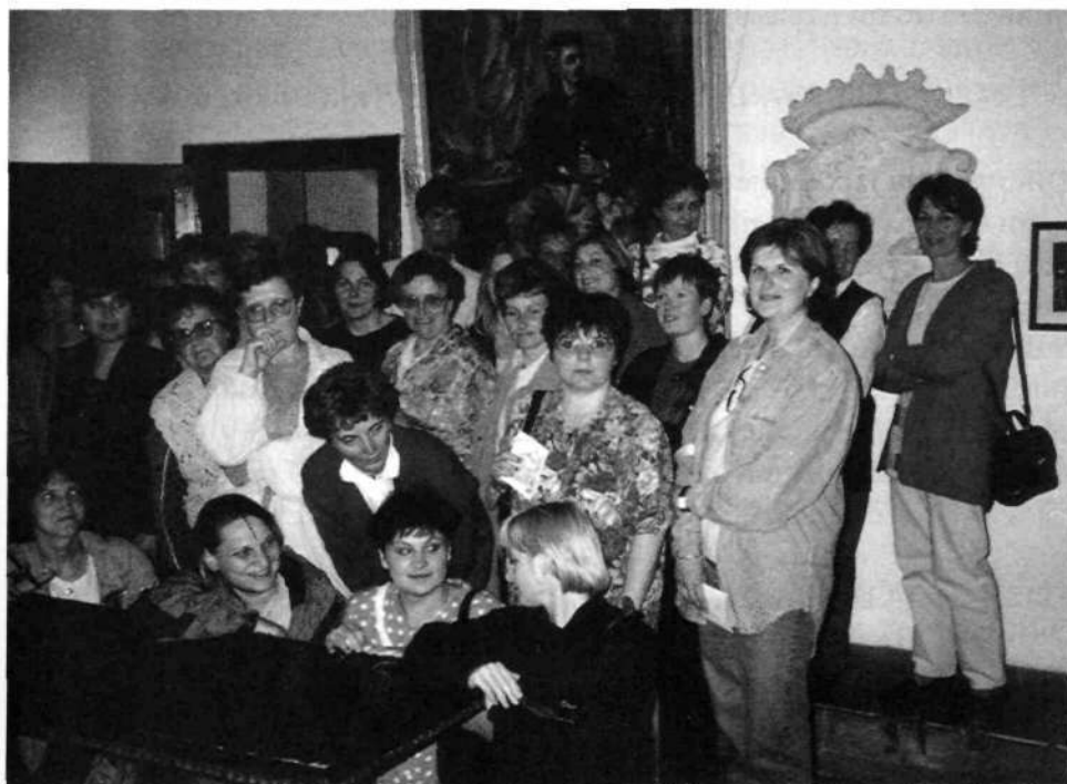
Slika 1: DBK v Predjamskem gradu