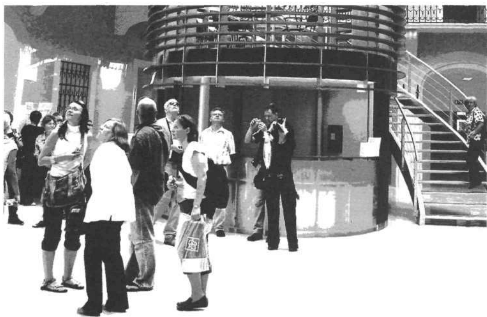
Slika 4: V hladu notranjega dvorišča Univerzitetne knjižnice v Bratislavi