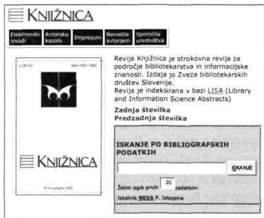
Slika 1: Spletna izdaja revije Knjižnica