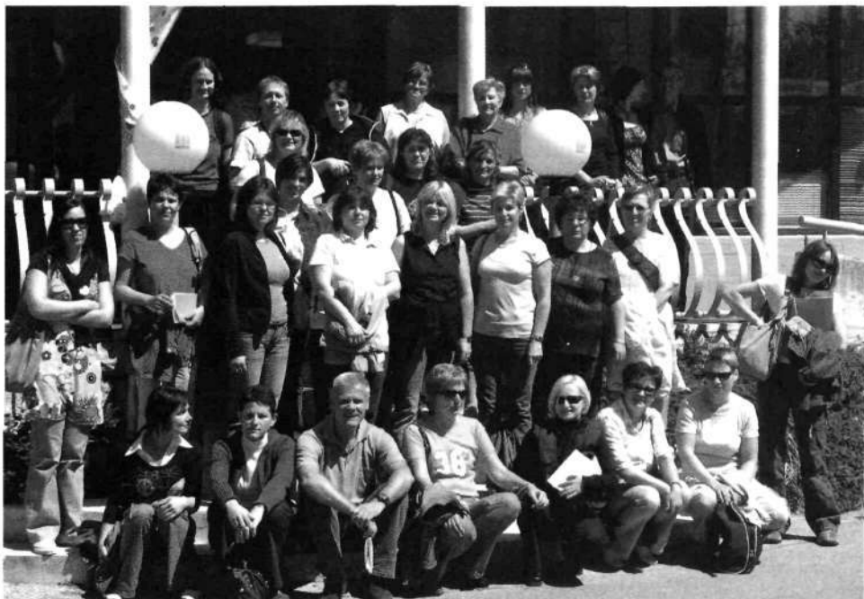
Slika 2: Strokovna ekskurzija DBK, Radovljica 2007