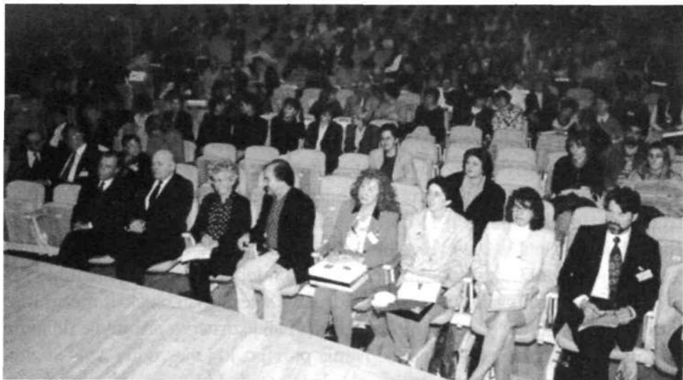
Slika 1: Posvetovanje ZBDS na Bledu (1995)

To je le kratek časovni pregled o delovanju Društva bibliotekarjev Gorenjske, najbrž pa bi bili bolj zanimivi kakšni osebni spomini na te dogodke iz preteklih let.