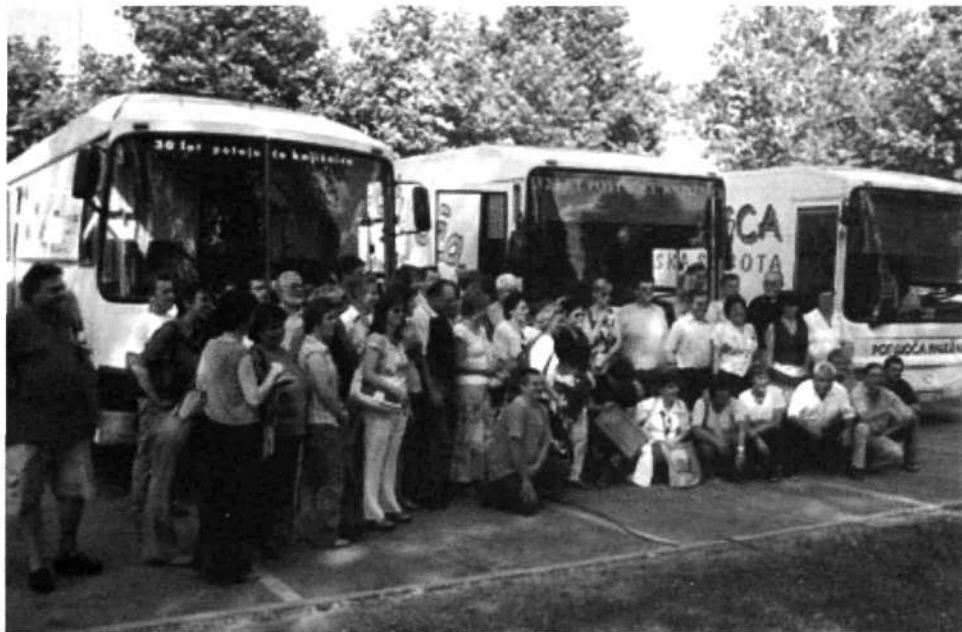
Slika 2: Srečanje potujočih knjižničarjev v Ljubljani 2006

gostov. V okviru našega strokovnega združenja smo se dogovorili o pomembnih vprašanjih, ki so pereča za vse potujoče knjižničarje, tekoče navezovali stike s tujino in se seznanjali z delom in izkušnjami kolegov od blizu in daleč.