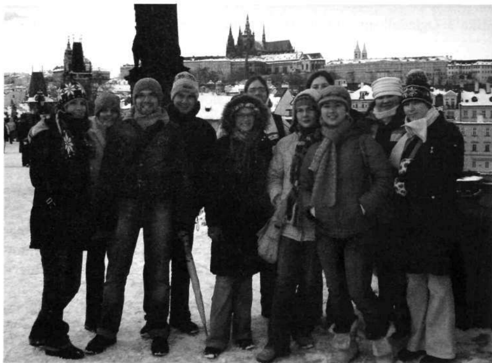
Slika 4: V letu 2007 je BOBCATSSS potekal v Pragi

Z organizacijo odhoda na BOBCATSSS sekcija promovira dogodke s področja bibliotekarstva v tujini in omogoča študentom bibliotekarstva, da se lažje udeležijo srečanj na mednarodni ravni. Tam se spoznavajo s študenti in strokovnjaki s področja bibliotekarstva in informacijske znanosti iz drugih evropskih držav in se tako postopoma integrirajo v stroko na mednarodni ravni. Hkrati pa jim udeležba omogoča aktivno sodelovanje s prispevkom ali pa jih vzpodbudi, da se tudi sami naslednje leto predstavijo s prispevkom. Udeležba naših študentov pa je pomembna tudi zato, ker se študentje na ta način seznanijo z aktualnimi tematikami in problemi iz bibliotekarske stroke ter poznavanje le-teh prenesejo v Slovenijo.