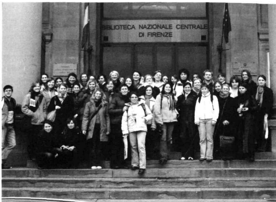
Slika 3: Ogleдали smo si tudi Nacionalno knjižnico v Firencah