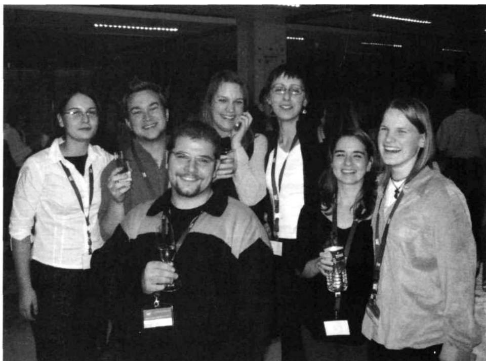
Slika 1: Študenti, ki so pomagali pri izvedbi posvetovanja visokošolskih in specialnih knjižnic novembra 2004

vrsti izvedenih projektov. Sekcija se je aktivno vključila tudi v promocijo samega študija bibliotekarstva, knjižničarske stroke in ZBDS, saj je sodelovala pri predstavitvi dejavnosti študentov in sekcije na informativnih dnevih, skrbela pa je za sprejem brucev in njihovo vključevanje v aktivnosti sekcije. Za bruce je v letu 2004 vzpostavila tudi strokovne vodene ogleds NUK, ki so ostali stalnica tudi v naslednjih letih. Pomemben napredek je bilo tudi sodelovanje sekcije pri izvedbi strokovnih posvetovanj, kjer so se študenti lahko dodatno izobraževali, si z delom nabirali izkušnje in se spoznavali z bodočimi delodajalci. Sekcija je za dodatno izobraževanje poskrbela tudi z uvedbo tridnevnihs ekskurzij v tujino, kjer se je dogovorila za ogleds najbolj zanimivih in znanihs knjižnic, ter z ohranjanjem izmenjave s hrvaškimi študenti bibliotekarstva. S pomočjo Primoža Bevca se je že v začetku mandata vzpostavila tudi spletna stran, kjer so bili objavljeni zapisniki sestankov, fotografije z ekskurzij, novice in tudi elektronska različica revije Štubidu. Štubidu je pod urednico Barbaro Plestenjak nadaljeval tradicijo svojega izhajanja, znašel pa se je tudi v marsikateri knjižnici po Sloveniji.