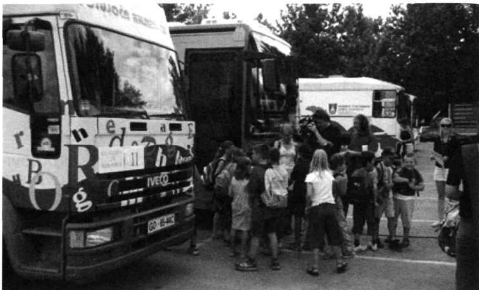
Slika 1: Mladi bralci na ogledu slovenskih potujočih knjižnic

Kakšno je torej delo v bibliobusu? Večina bralcev nas pričakuje na postajališču že vsaj četrta ure prej, in ko se naša vrata odprejo, vstopijo vsi hkrati. Ves čas postanka ostajajo obisk, izposoja in vračanje gradiva močno zgoščeni. V bibliobusu, ki na približno 12 m 2 premore v najboljšem primeru do 5.500 knjig in nekaj sto enot neknjižnega gradiva, je zaradi velikega števila izposoje treba redno, sprotno ter hitro in pravočasno dodajati in pestriti vse gradivo v vozilu.