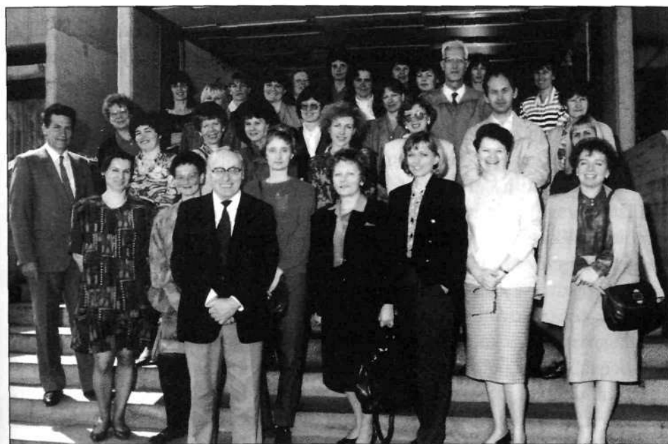
Slika 4: Visokošolski knjižničarji na seminarju, Ekonomska fakulteta, Ljubljana, 4. in 5. maj 1993

Visokošolski knjižničarji so bili ves čas dejavni na posvetovanjih zveze, v zadnjem desetletju pa tudi na posvetovanjih, ki jih je vsako drugo leto organizirala sekcija sama, ali pa skupaj s Sekcijo za specialne knjižnice.