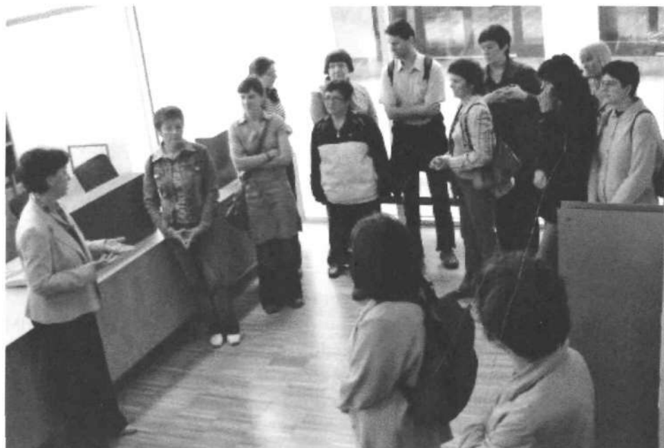
Slika 2: DKD na obisku v Knjižnici Grosuplje, 2007