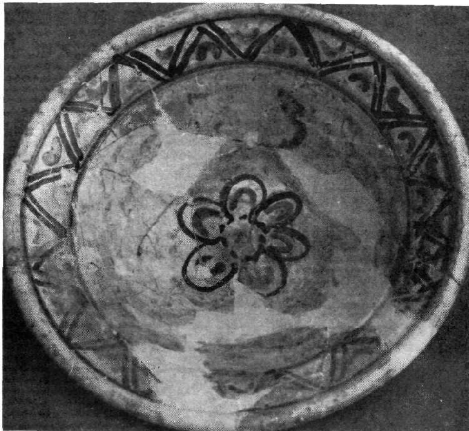
Skofja Loka — Poljanska vrata: skleda s slikanim večbarvnim ornamentom

ali oglatimi linijami, sosledja črt, pik, cikcak ornamentov, trikotnikov, mrež in številnih kombinacij teh in podobnih motivov. Izraznost te motivike sega od realističnih do stiliziranih prikazov. Težko je tu navesti vse bogastvo motivov, najbolj obširno nam pač spregovori razstavljeno gradivo samo.