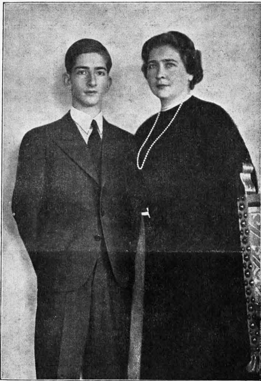
Nj. Vel. Kralj Petar II i Nj. Vel. Kraljica Marija