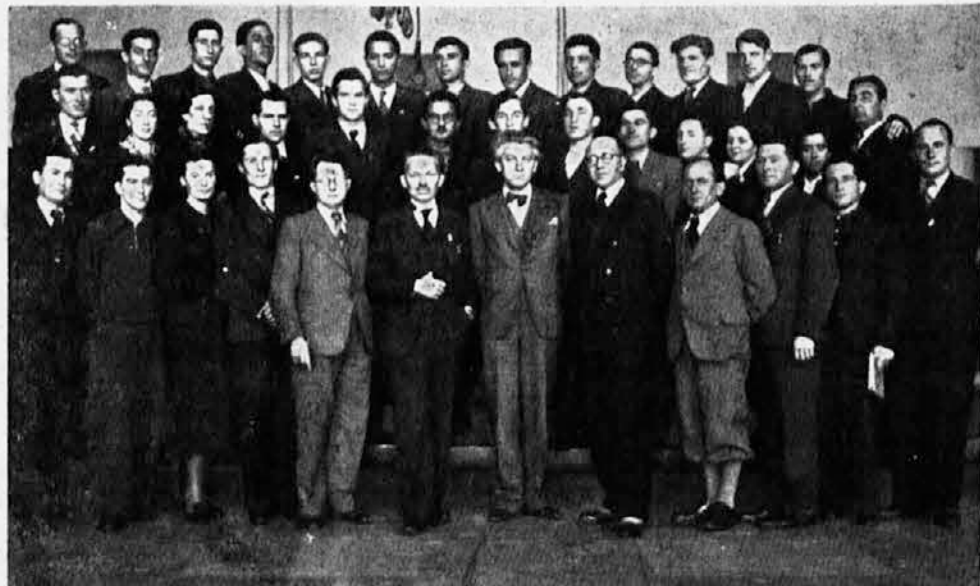
Učesnici i nastavnici saveznog muzičkog, lutkarskog i pozorišnog tečaja, održanog u Novom Sadu od 30-XII-1937 do 4-I-1938

Kalendar je uredio brat Verij Švajgar. Cena mu je Din. 7.— i naručuje se kod Jugoslovenske sokolske matice, Ljubljana.