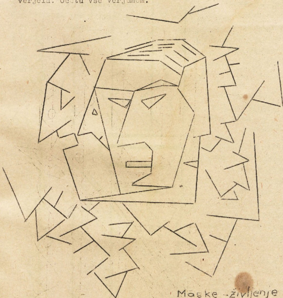
Maske - življenje

"Majčkeno, majčkeno je življenje, ko je človek sam, čisto sam in se mu zazdi, da ga nima nihče rad, to že - drugače pa imajo pisatelji prav." je dejal enkrat in jaz sem mu verjela. Očetu vse verjamom.