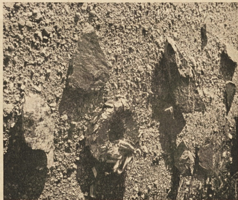
Edinole dan poprej položeni venec je ostal nepoškodovan, medtem ko so drobci razstreljenega spomenika posejani daleč naokrog.