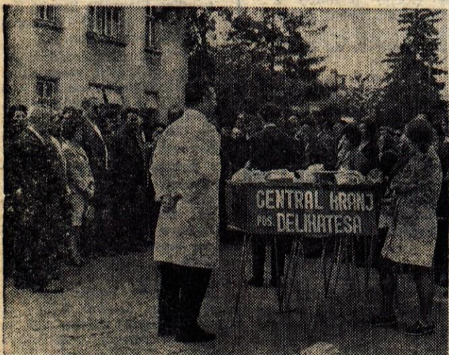
Pred odhodom na izlet sta uslužbenca kranjskega podjetja Central našim izžrebancem razdelila bogate popotnice.

SAP TURIZEM IN GOSTINSTVO LJUBLJANA • TITOVA 38 • 314-922, 315-342