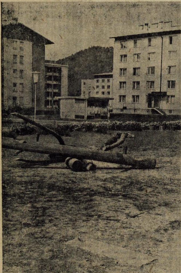
Z betonskega podstavka so objestneži odtrgali in prestavili gugalnico.