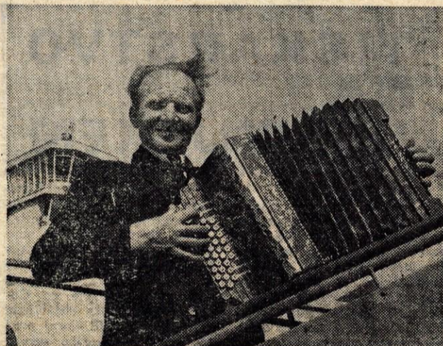
Harmonikarju Franciju, Grčiču domače, zlepa niso pošle moči. Ves ljubi dan je nategoval svoj meh in še v letalu, 3000 metrov visoko, ni prenehal pritiskati na tipke.

Dvajset minut kasneje smo znova ždeli v avtobusih, ki sta jo ubirala proti Brniku. Bližal se je veliki finale — potovanje z letalom DC-6, last podjetja Inex-Adria avio-promet. V restavraciji aerodroma Ljubljana so nam najprej servirali obilno ko-