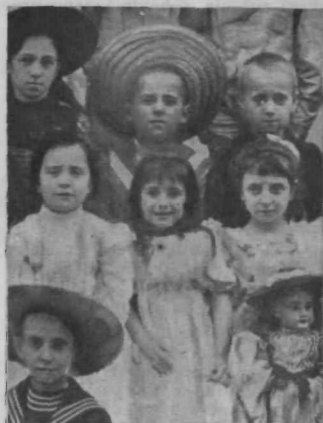
Levo: Prva francoska šolska naloga sedemletnega princa v osnovni šoli v Ženevi (Švica). Desno: Naš nepozabni kralj Zedinitelj (v sredi s širokim slamnikom) med svojimi součenkami in součenci