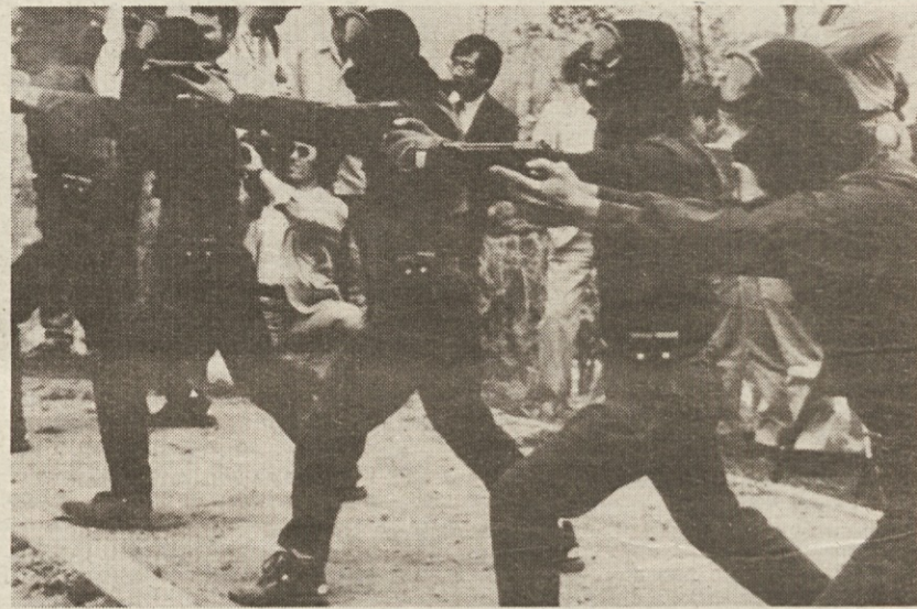
Da bi poskrbeli za čim večjo varnost na septembrskih olimpijskih igrah v Seulu, se že zdaj pripravljajo posebni protiteroristični vojaški oddelki