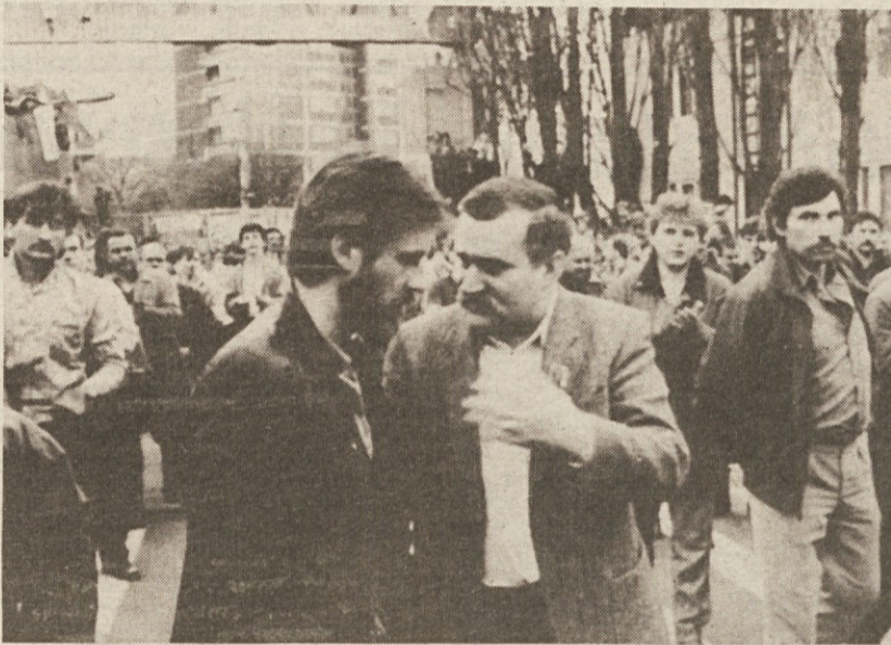
Voditelj Solidarnosti je včeraj v Gdanku ponovno spregovoril stavkajočim (AP)