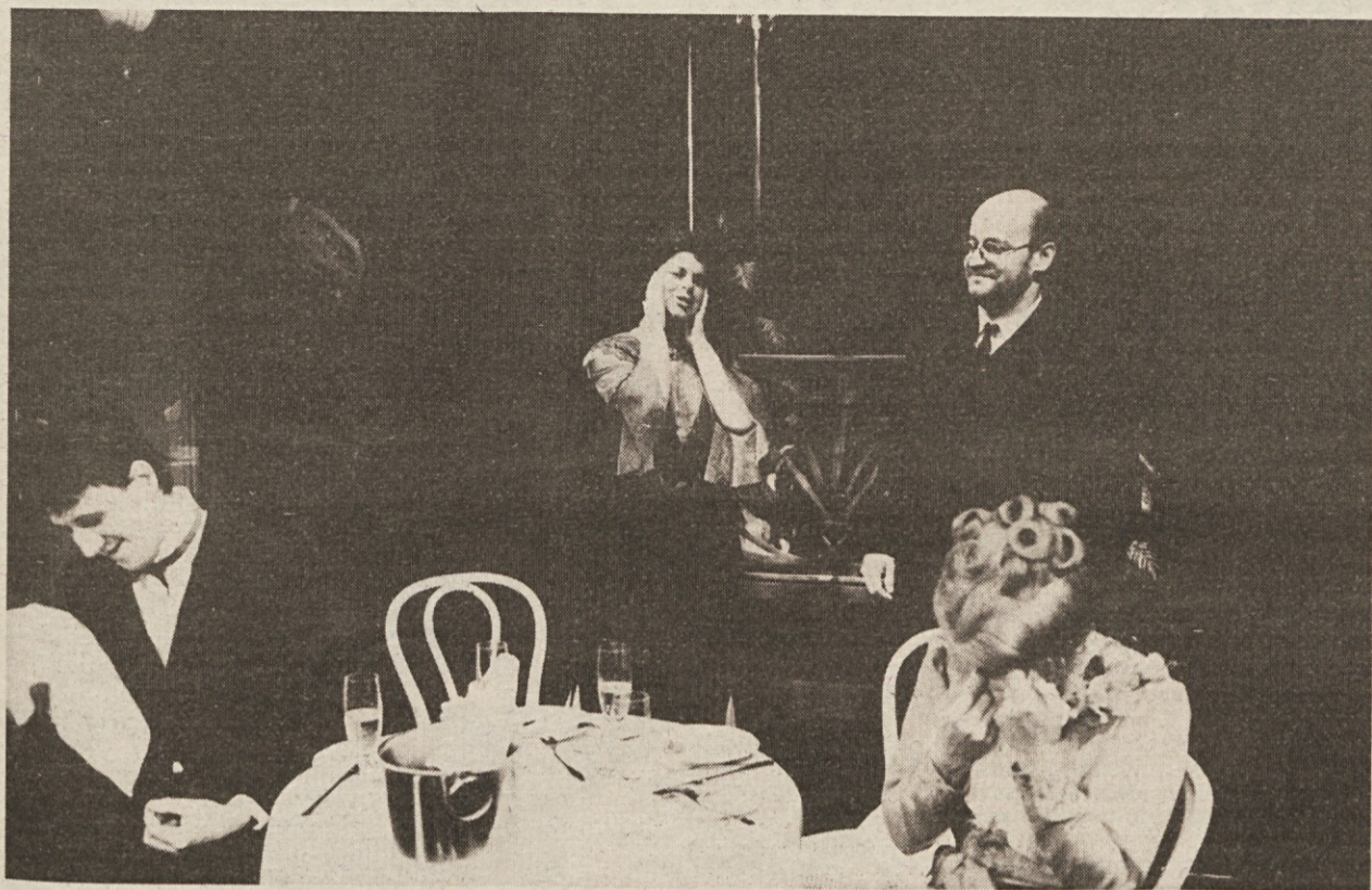
V okviru abonmajske sezone Slovenskega stalnega gledališča gostuje od včeraj v Kulturnem domu Drama SNG iz Maribora. Do nedelje bo našemu občinstvu igrala Ženitno mešetarko Thorntona Wilderja, znanega ameriškega pisatelja in dramatika. Gre za odlično bulgarsko komedijo z ostro zarisanimi karakterji, ki se razvijajo v številnih komičnih situacijah, kar je idealno za smeha željno publiko