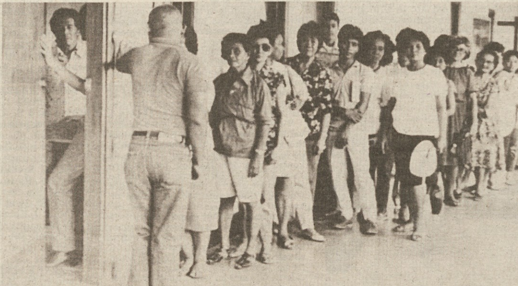
Dolge vrste Filipincev pred bolniško sobo matere bivšega filipinskega diktatorja Marcosa dokazujejo, da bo opozicija tudi to smrt politično izkoristila, ker Aquinova ne bo pustila Marcosu, da se udeleži pogreba