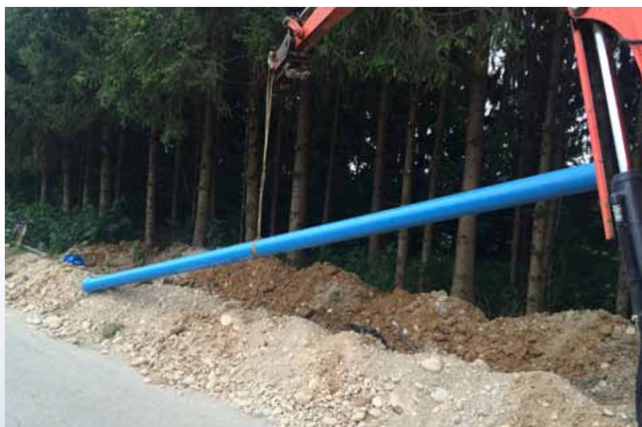
Transport in polaganje novih Ductil cevi v peščeno posteljico v jarek ob dovozni cesti

Obnova vodovoda farma-Repnje, odsek farma-regionalna cesta Vodice-Lj. Šmartno, 2. faza