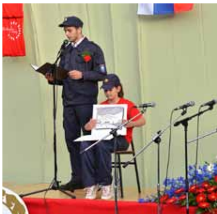
Recital z ilustracijami,

tisočletnih sanj Slovenk in Slovencev. Zato je treba ta državniški korak za vedno globoko spoštovati in ga ponosno proslavljati.