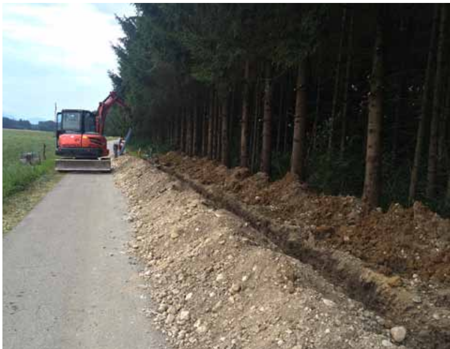
Pričetek 2. faze zamenjave cevododa

Občinski svet Občine Vodice je s potrditvijo in sprejetjem Letnega programa dela JP Komunala Vodice, d.o.o., za leto 2015 »prižgal zeleno luč«, da lahko JPKV vodi določene investicije v imenu in na račun Občine Vodice. Tako smo v mesecu juliju 2015 nadaljevali obnovitvena dela na komunalni infrastrukturi, predvsem na vodovodnem sistemu. Obnavljamo oz. zamenjujemo predvsem azbestno-cementne cevovode zaradi do trajanosti, saj menimo, da so eden od pglavitnih vzrokov za vodne izgube.