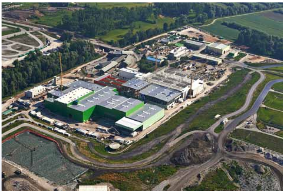
Gradnja tovarne za predelavo odpadkov je v zaključni fazi.