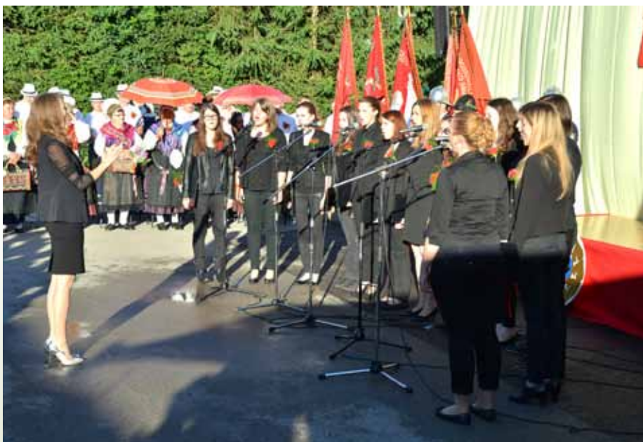
Dekliški pevski zbor Flora

V Občini Vodice smo ponosni in zadovoljni, da imamo danes to čast in priložnost, da skupaj z vami proslavljamo dve pomembni obletnici. Skupna izvedba slovesnosti, praznovanja 24. obletnice dneva državnosti in praznovanja ob častitljivi 90. obletnici delovanja Prostovoljnega gasilskega društva Šinkov Turn je izrednega državnega in občinskega pomena. V četrtek, 25. junija 2015, bo Slovenija praznovala 24. obletnico, zato je prav, da danes naši domovini izkažemo vso čast in skupaj proslavimo dogodek, ki je omogočil rojstvo naše države, naše Slovenije. To je bil takrat res pogumen in odločen korak slovenskega parlamenta. Ta odločitev je pomenila dejansko rojstvo naše samostojne države, s čimer je bil storjen najpomembnejši korak za Slovenijo. Končno je bilo to dejanje uresničitev