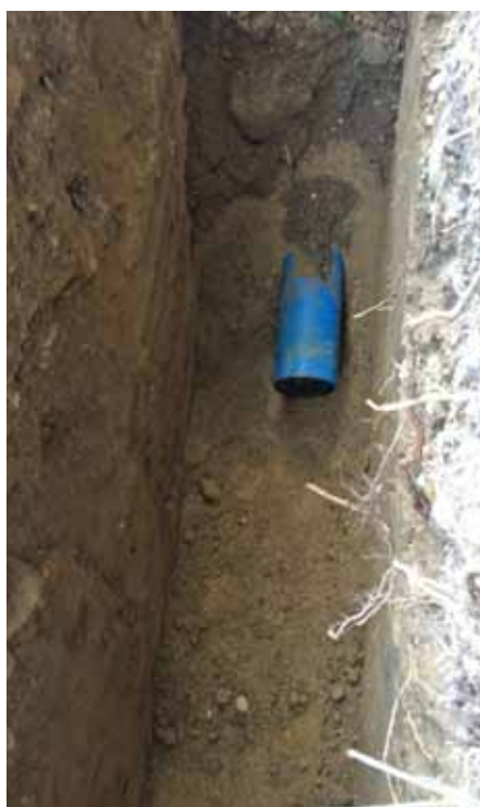
Cevovod, položen na peščeno posteljico,

Občina Vodice je tako s prerazporeditvami zagotovila preostali delež sredstev, da je načrtovani obseg obnove lahko v celoti izveden.