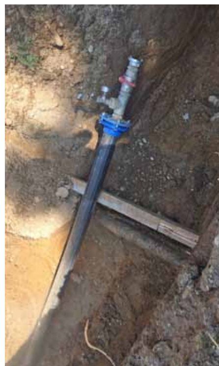
Izvedba tlačnega preskusa dobro zaščitno obsut in dokončno zasut. Preostanek vidne cevi čaka na novo cev.

Kljub zmanjšanju nepovratnih sredstev smo ob zagotovitvi preostalega deleža iz občinskega proračuna vseeno izvedli zamenjavo AC cevovoda z lito železnimi Ductil cevmi v celotno predvideni dolžini 150 m.