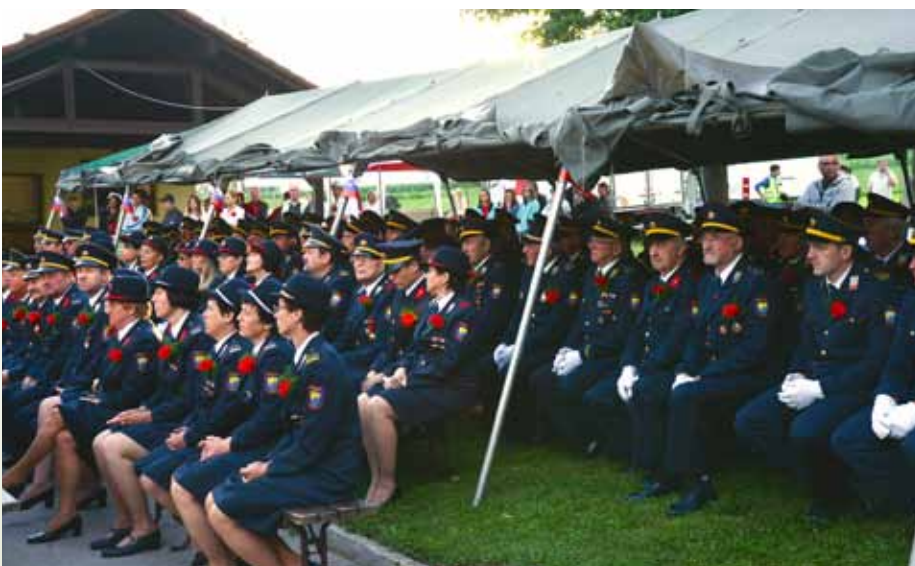
Gasilci in gasilke GZ Vodice

Po zaključenem programu sta sledila odhod praporov in zabava s srečelovom in ansambloma Skrivnost in Mladi Dolenjci.