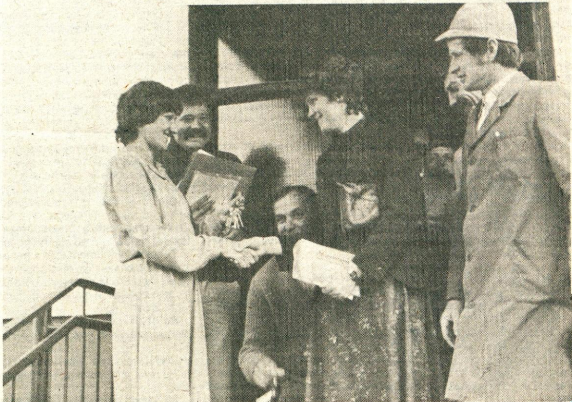
V novem bloku v Borovnici je 26 stanovanj. Od tega je 12 solidarnostnih, med katerimi so bila tri zgrajena iz srestev skupnosti invalidsko pokojninskega zavarovanja in so se vanje vselili upokojenci. 6 je etažnih lastnikov, 8 stanovanj pa so kupile organizacije združenega dela za svoje delavce. Kvadratni meter stanovanja je stal 19.000 din, seveda pa je v tej ceni tudi zunanja ureditev soseske.

Ker na predlog Programskih usmeritev za delo občinske organizacije ZKS ni bilo dodatnih pripomb, so člani konference sprejeli Programske usmeritve.