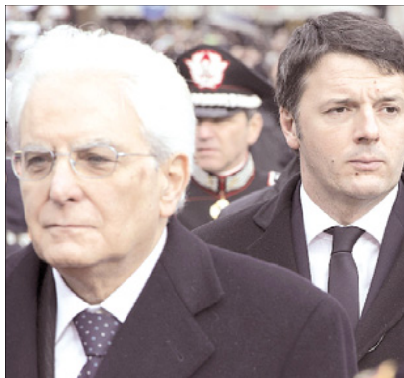
Predsednik republike Sergio Mattarella in v ozadju premier Matteo Renzi

Pisani parlamentarni opoziciji ostaja sedaj možnost ljudskega referendumu, za katerega je treba zbrati podpise in potem prepričati volivce, da zakon zavrnejo. To je precej zahtevna naloga, zato nekateri upajo, da Italicum ne bo prestal ustavne presoje. Pravniki so glede tega še kar razdeljeni. Nekateri so prepričani, da so nova volilna pravila skladna z ustavnimi načeli, drugi pa ne.