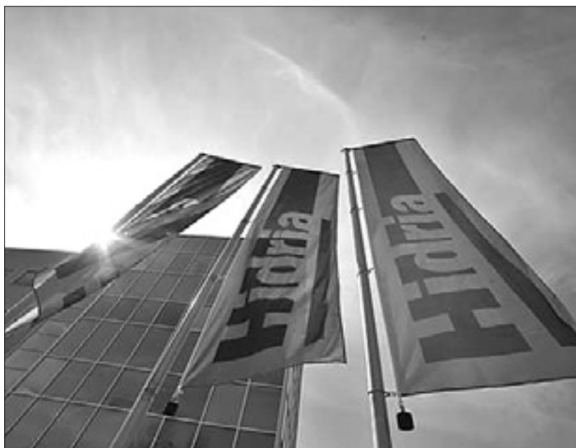
Koncern Hidria domuje v Idriji in v Ljubljani

Hidria, katere sedeža sta v Ljubljani in Idriji, je avtomobilske proizvajalce znova prepričala s svojo inovativnostjo in kakovostjo, ki jo je tokrat uporabila pri razvoju in izdelavi sistema elektromotorja in generatorja v t.i. »mehkih hibridih«. (STA)