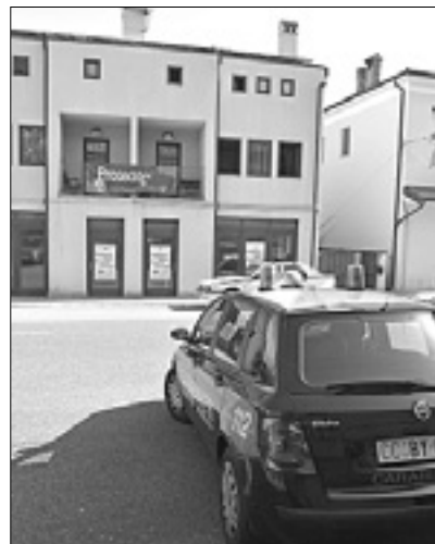
Poslopje na Proseku

je zdravnica v nočnih urah ugotovila, da prispeli niso bili okuženi z nalezljivimi boleznimi. Ob prvem prihodu so med dospelimi ugotovili tri primere garrij, kar je vzbudilo v javnosti preplah, zato so se vdrugič pri zdravstvenem podjetju odločili za takojšnje, preventivne preglede.