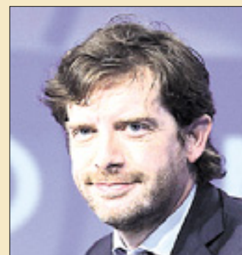
Poslanec Giuseppe Civati

RIM - Poslanec Giuseppe Civati je včeraj zapustil Demokratsko stranko in istočasno njegovo parlamentarno skupino. Njegova odločitev nikakor ni nepričakovana, saj je bil Civati že dalj časa zelo kritičen do predsednika vlade Mattea Renzija in do njegovega vodenja DS. Civati bo za sedaj prestopil v mešano poslansko skupino, razmišlja pa o oblikovanju nove levo usmerjene stranke, katere sestavni del naj bi postala SEL Nichija Vendola. SEL je včeraj navdušeno pozdravila Civatijev odstop iz DS.