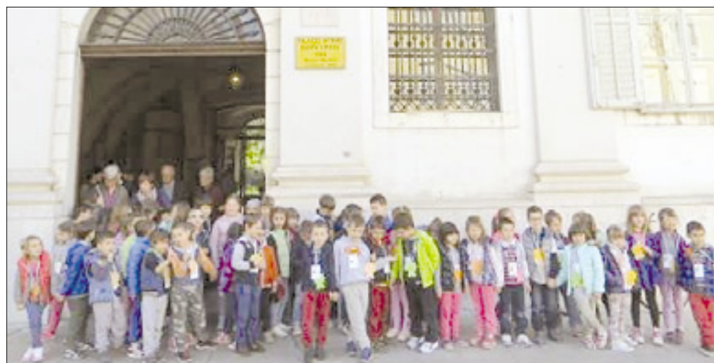
Otroci slovenske šole in vrtcev pred goriško mestno hišo

Učenci prvega razreda štandreške osnovne šole Franca Erjavca ter otroci zadnjega letnika vrtcev Sonček in Pika Nogavička so obiskali goriško mestno hišo. Že vrsto let potekajo srečanja, ki nudijo malčkom slovenskim vrtcev iz Gorice in Štandreža možnost, da se postopno vključujejo v šolsko okolje in se soočajo z novimi izkušnjami, tokrat pa so se prvošolci in otroci tretjega letnika vrtca skupaj udeležili občinske pobude A scuola di comune .