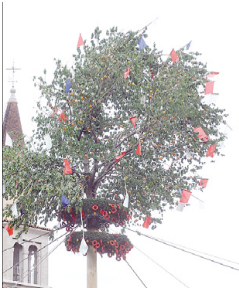
Maj okrasijo s pomarančami, kolači, zastavicami ...

Župana izberejo neporočeni fantje in neporočena dekleta. Včasih ni bilo tako. Ženske v tej zadevi niso imele besede. Sredi 80-tih let prejšnjega stoletja pa se je uradno oblikovala dekleška skupina, ki je začela imenovati