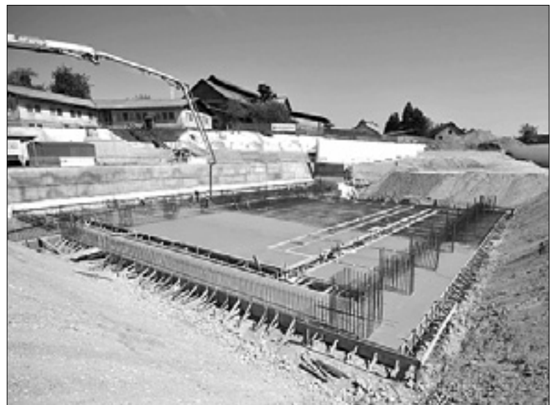
Gradbišče novega Islamskega kulturnega centra v Ljubljani

Projekt je po sedanjih računih vreden okoli 22 milijonov evrov, prva faza gradnje naj bi bila končana prihodnje leto