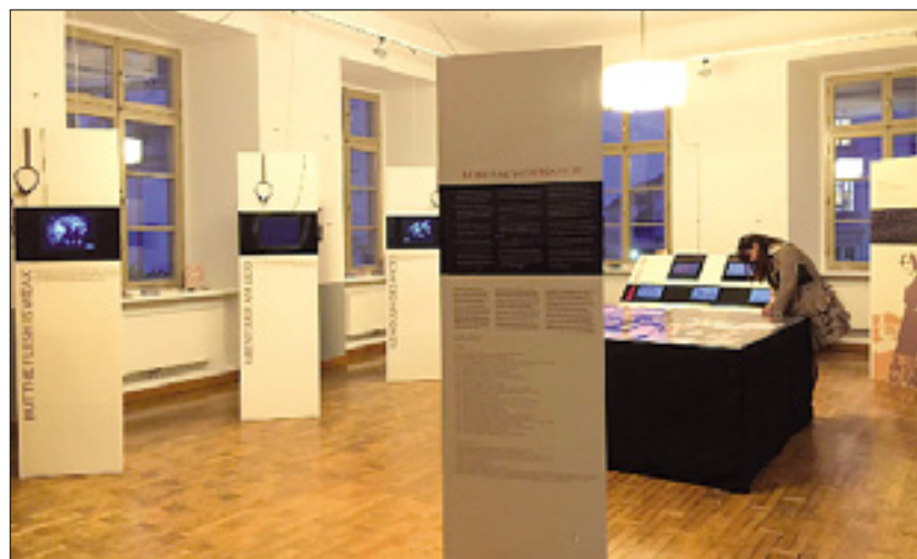
V graškem gledališču so postavili tudi razstavo goriškega Kinoateljaja

Pod sloganom Nora v mestu tudi v Gradcu, kot doslej v Trstu, Gorici, Ljubljani in Novi Gorici, potekajo sprem-