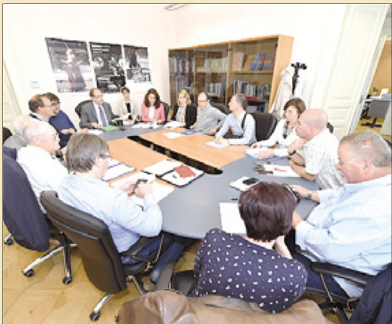
Včerajšnja seja posvetovalne komisije FJK za slovensko manjšino

Rod modrega vala-Zapojmo, ne boj se pesmi: 5.000 evrov.