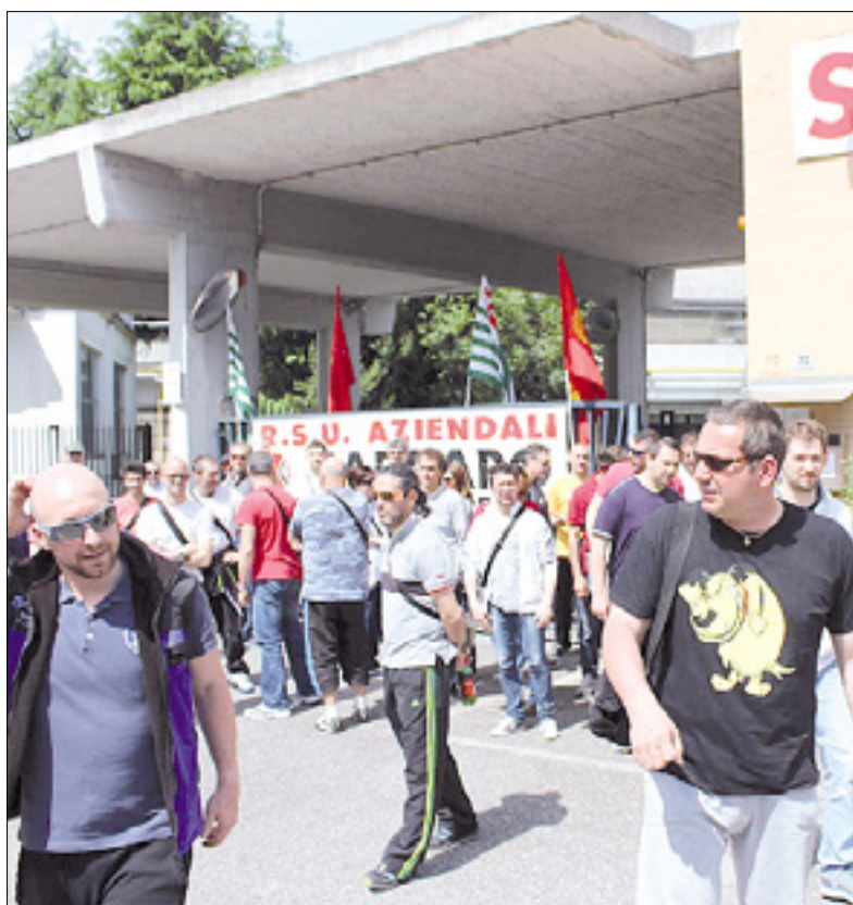
Delavci tovarne Siap pred tovarno

V pričakovanju na posredovanje politike so obupani delavci na torkovi izredni skupščini odločili za prekinitev proizvodnje in zasedbo tovarne, dokler si ne bo vodstvo družbe Carraro premislilo in preključilo odločitve o zaprtju. Včerajšnji dan so preživeli pred glavnim vhodom v Ulici Brigata Casale v Stražah, kjer so zaplapolale zastave sindikalnih združenj. Namestili so tudi transparent enotnega sindikalnega