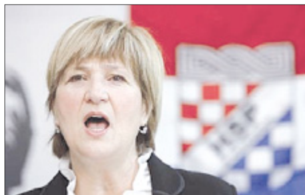
Evropska poslanka je razburila duhove tudi v Srbiji in BiH