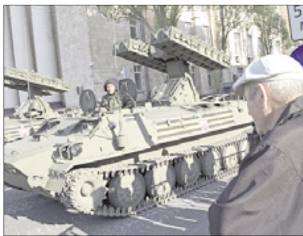
Na vzhodu država so v zadnjih dneh zabeležili več novih kršitev premirja na obeh straneh