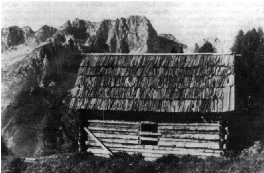
Gozdarska koča na planini Prisojnik (T. Vraber, 1965)

deljuje precej veliko pašno območje na obeh straneh prelaza Vršič; levo in desno sega vse do planine Trente oziroma Prisojne planine.