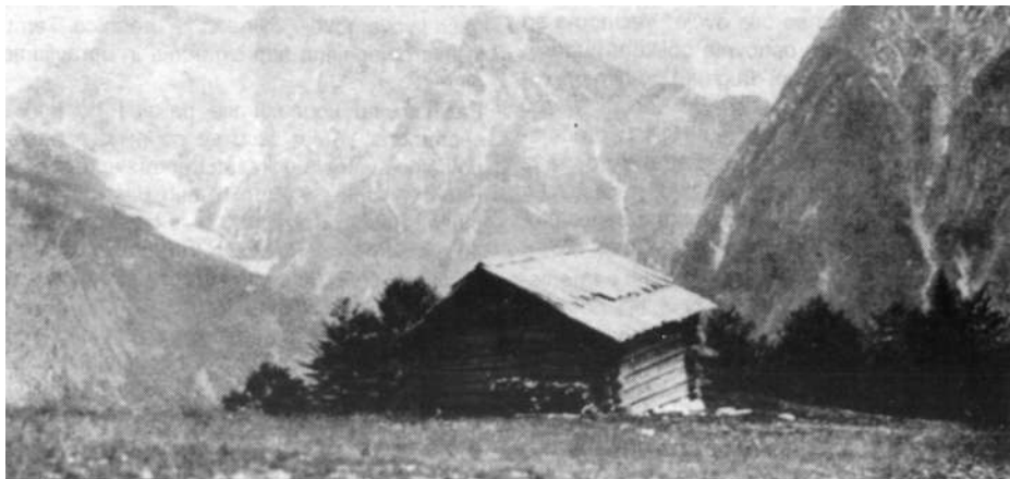
Planina Trenta (V. Dvorsky, 1914)

proti Špički. Običajno so prenesli utro planine nižje zaradi potrebe po lesu, ko so posekali že ves gozd okoli planine. V tem primeru pa je bila morda vzrok tudi voda, saj na vsem pobočju ni izrazitih stalnih virov. Novo utro je imelo vodo kakih 150 metrov nižje v gozdu. Na planini so zadnjič pasli okoli 1918. leta, stan pa je propadel po letu 1930.