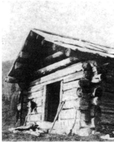
Vhod v stan planine Trente (A. B. de Chesne, 1913)

Trentarske planine so bile ovčje. Večinoma so bile grajene v dveh osnovnih oblikah: hudrt in hrami so bili postavljeni drug nad drugim pravokotno na teren ali pa so bili ločeni v več poslopjih. Osrednji prostor je bil tisti za predelavo mleka. Poslopja so bila do strehe zidana iz kamenja, vse drugo pa je bilo iz lesa. Le ponekod se pojavlja kot dodatni gradbeni material tudi pločevina ( Križner 1972, Cevc 1984). Dolinske planine pa so bile večinoma namenjene jalovi goveji živini, zato niso bili potrebni hlevi. Za pastirje je bil postavljen skromen stan - lesena brunarica, ki je precej značilna za gorenjsko arhitekturno izročilo. Prostor je bil samo eden velikosti 5 x 6 metrov. Grajen je bil iz obtesanih brun, v vogalu povezanih na brade. Prostor je bil brez oken, imel je le eno ali dve