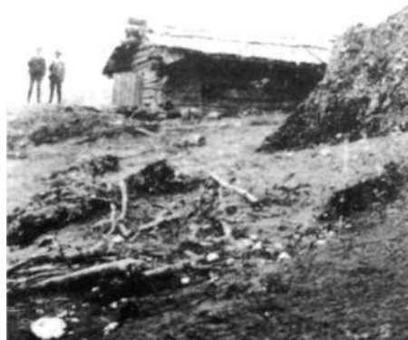
Planina Prisojnik (A. B. de Chesne, 1912)

Velika planina je najbolj razširjeno ime, ki opre-