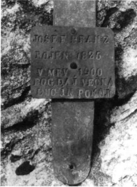
Spominska ploščica preminulemu dolinskemu planšarju, najdena na planini Trenta leta 1960 (E. Kozorog)

Rutarska Trenta pa je ime, ki je lastninskega izvora.