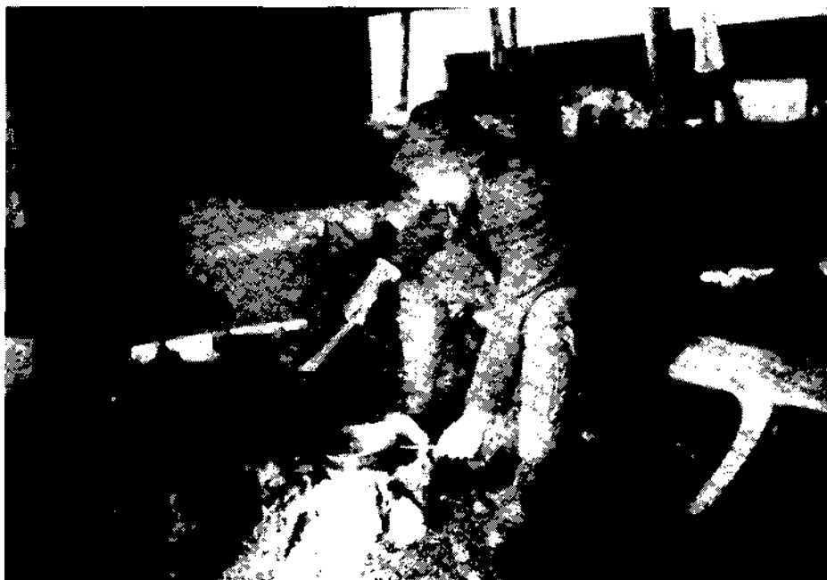
Notranjost planine Prisojnik (A. B. de Chesne, 1912)

planini Prisojnik. Sirili so še v lesenih posodah; mleko so segrevali tako, da so na ognju segrevali kamenje in ga dajali v mleko (Pretner 1990). Zato lahko domnevamo, da so bile te planine v preteklosti drugače urejene.