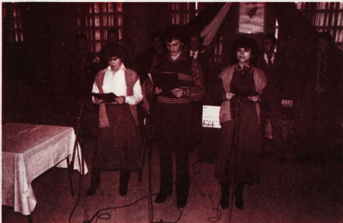
OB SREČANJU KAKOVOSTEN PROGRAM – Mladinci iz TOZD kodranka in volna niso bili aktivni samo pri čiščenju okolja. Dokazali so, da so tudi dobri recitatorji in da jim lahko zaupamo odgovorne naloge.