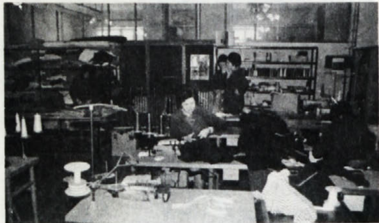
BOLJŠE MOŽNOSTI – Nekdanjo sejno sobo smo preuredili v vzorčni oddelek. Dekleta imajo zdaj več prostora.

Ko zdaj, v času energetske krize, premog zopet prihaja v ospredje, bi se nekaterim proizvajalcem težkih dizelskih motorjev morale pravzaprav tresti hlače, ker bi morala biti po vseh predvidevanjih njihova proizvodnja ogrožena. Pristaši dizlovske pogona pa so mirni, saj menijo, da se da tudi iz premoga pripraviti kurivo za dizlove motorje. Kot zanimivost navajajo, da je že prvi Dieslov stroj pravzaprav gnil premogov prah.