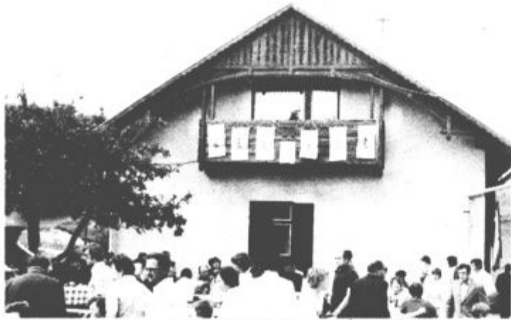
Lovski dom v Skornem

Ko so nekako pred tremi leti v Skornem nad vasjo Gorenje zaradi premajhnega števila učencev in pomanjkanja učiteljev zaprli štiriletno osnovno šolo, je ta učilna začela obetati, da bo počasi propadala. Šm arški lovci so se po dveh letih nevzdrževanja tega objekta odločili, da ga odkupijo in preuredijo. V dogovoru s skupščino občine Velenje, krajevno skupnostjo Gorenje, prosvetnimi delavci in še nekaterimi drugimi, so julija lani pričeli za obnovitveno šole. Njihova želja je bila, da v njej uredijo lovski dom, ki ga za svoje delo ne bodo uporabljali le lovci, marveč tudi krajanji Skornega. Krepko so zavahali rokave in naporu so kmalu začeli rojevati prve sadove. Stopili so v nabiralno akcijo in si zadali obvezo, da vsak lovec pri urejanju doma opravi sto udarniških delovnih ur. Dom je počasi dobival končno podobo in sklenili so, da ga svečano izročijo svojemu namenu prav na dan vstaje slovenskega naroda. V njem so poleg kuhinje, sanitarij in posebne sobe uredili še večji prostor, kjer bodo prirejali sestanke in razna posvetovanja in ki bo lahko služil tudi raznovrstnemu udejstvovanju krajanov Skornega. V zgornjem delu pa bo kmalu urejena soba za prenočevanje. Nadvse skrbno so se lotili tudi okolice. Velika te-