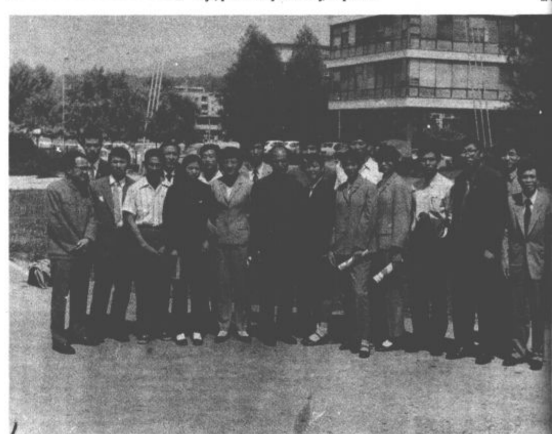
Kitajski atleti z vodstvom