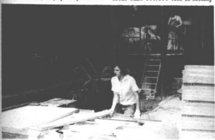
Del proizvodnje v EFE