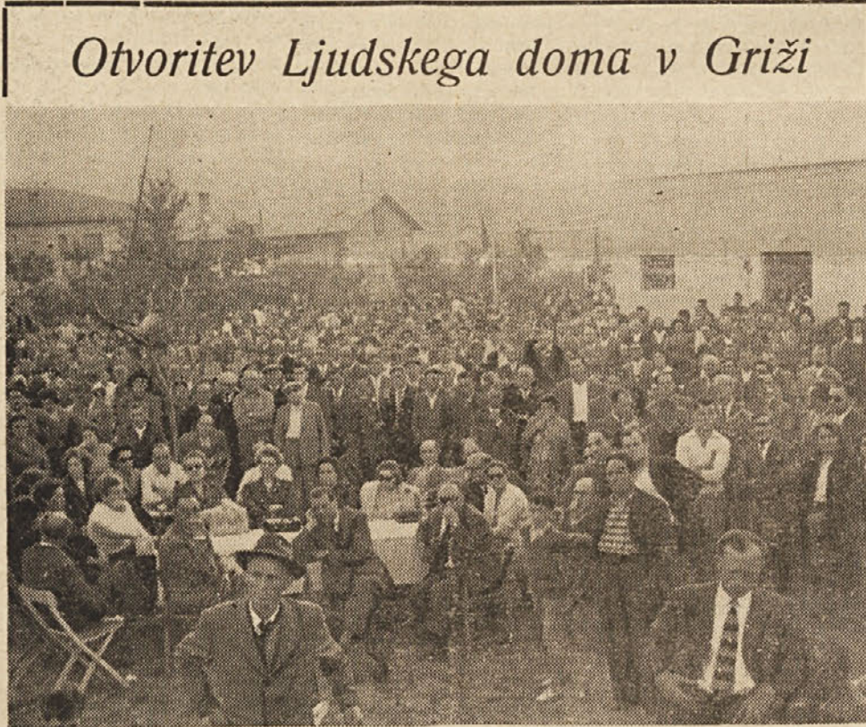
Otvoritev Ljudskega doma v Griži

Zato mislim, da mladinska gibanja, ki so ob priliki 2. junija objavila skupen lepak in pri tem prezrli mlade komuniste, to je, najboljši borbeni in organizirani del mladine, niso napravila dobre usluge stvari mladine, niso dala doprinosu utrditvi enotnosti mladine za rešitev njenih problemov, marveč so se pustila zapeljati na blatni teren protikomunizma. Mislim, da tolmačim občutek velikega dela mladine, ko pozivam voditelje mladinskih gibanj socialistov, socialnih demokratov, republikancev, radikalov, od „Unità Popolare“, naj