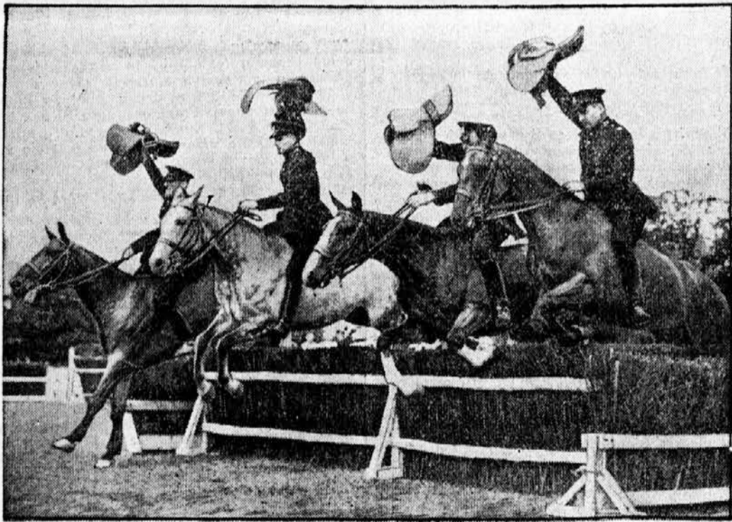
Angleška policija pri vajah v jahanju brez sed'la

namen teh razpravljanj, ki naj pokažejo samo žalostno in tragično plat v usodi velikih človeških duhov.