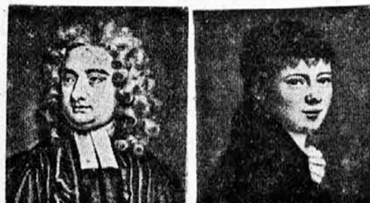
Jonathan Swift Heinrich von Kleist

Veliko z norostjo zaznamovanih se je mirno vdalo v božjo voljo. Vedeli so, kakšen konec jih čaka. V svetlih trenutkih so potrkljivo čakali, da se spet vrnejo v duševni mrak. Niso se upirali usodi, vedeli so, da so samo šibki ljudje, ki ne morejo nič proti nedoumljivim silam. Ti so bili večji junaki, kakor oni, ki so pred mrakom bežali v smrt.