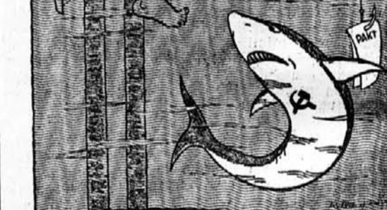
Takole si Nemci predstavljajo angleško-nemška pogajanja v Moskvi

Torek, 25. julija: Belgard; 20 Narod. pesmi; 20.30 Ork. koncert — Zagreb; 20 Vok. koncert; 20.30 Klavir; 21 Plošče Bratislava; 19.30 Slovaška naroda; 21.10 Domača glasba; 22.15 Slovaški ples — Sofija; 20 Kor. morni koncert; 20.0 Ruske romances — Varšava; 19.30 Ork. in solisti — Trst, Milan; 17.15 Violina; 21 Giordano opera »Siberia« — Rim-Bari; 21 Simf. koncert — Dunaj; 20.15 Ork. in solisti — Berlin-Stuttgart; 20.15 Plesna glasba — Hamburg-Frankfurt; 20.15 Sereña, de — Bratislava; 20.15 Korabnice — Monakovo; 19.15 Kmečke pesmi; 21.15 Reportaža s plezalne ture — Ber. romanser; 19.42 Nar. pesmi — Strassbourg; 30 Alzaska ura; 20.30 Vojaška godba.