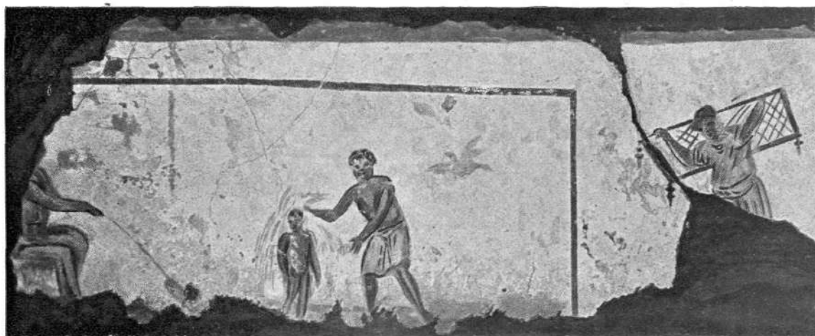
Ribič. Krst. Ozdravljenje mrtvoudnega. V katakombah Kalisto, 2. polovica II. stoletja.