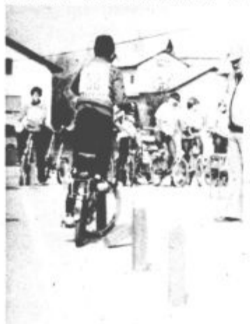
Spretnostna vožnja na poligonu je povzročala največ težav

nam je ob koncu dejal, da je zadovoljen z organizacijo in potekom tekmovanja, manj pa z udeležbo tekmovalcev. Predvsem ni bilo tekmovalcev iz