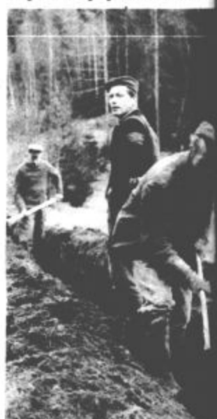
Mladim so priskočili na pomoč tudi domačini

zagnali v zemljo in že nekoliko utrujena telesa so se naprili in potila v prijetnem soncu.