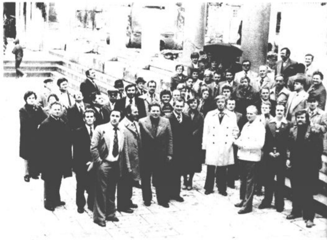
Velenjski krvodajalci med ogledom znamenitosti Splita

„Naši bratski odnosi s tem niso ostali le protokolarni, ampak so spodbudili širok spekter medsebojnega sodelovanja. Steklenice krvi velenjskih krvodajalcev pa bodo nedvomno spodbudile mnoge naše