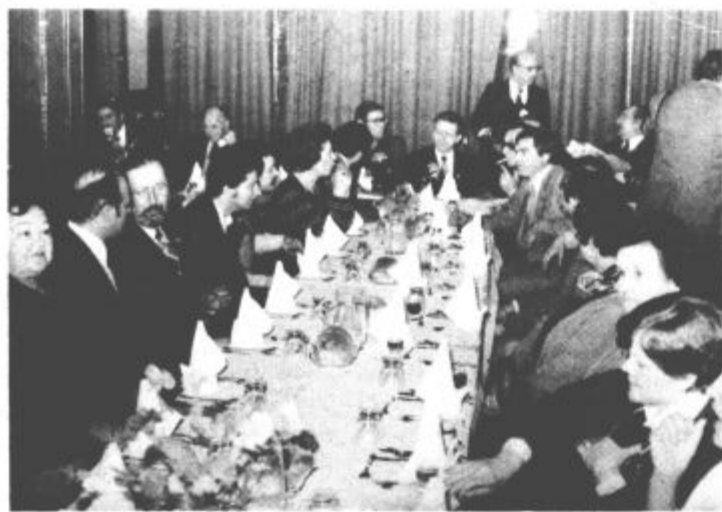
Krvodajalci Velenja in Splita med prijateljskim srečanjem