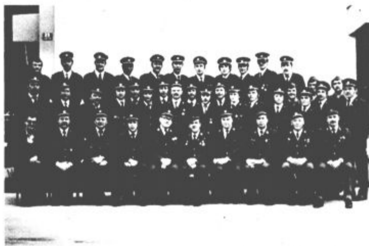
Občinska gasilska zveza Velenje je organizirala v sodelovanju z gasilskimi društvi občine Velenje tečaj za gasilskopodčastnike. Tečaj je trajal od 13. februarja do 8. aprila, udeležilo pa se ga je 34 gasilcev, ki so morali opraviti preizkus znanja iz desetih predmetov.