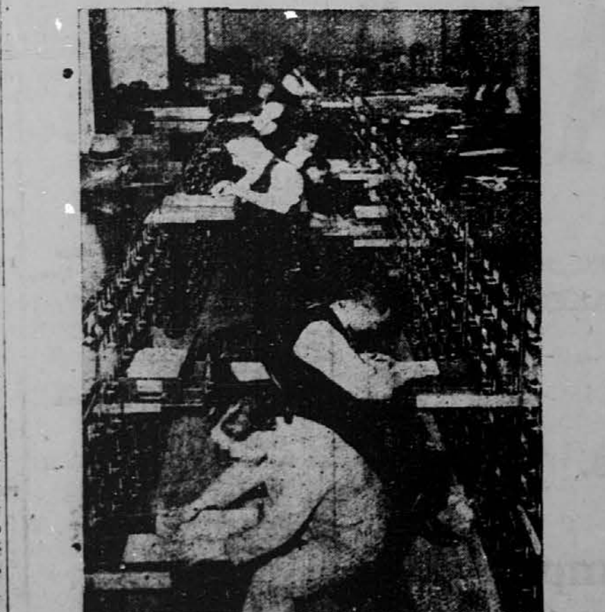
V Baltimore, Md., je zaposlenih nad 1.900 oseb, ki urejujejo rekorde onih, kateri so podvrženi novi vezni postavi za starostno poknjino. V tozadevni sklad morata plačati delavec in delodajalec po en odstotek tedenskega zaslužka.