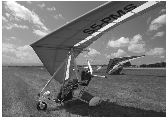
Obiskovalci so si lahko ogledali različna plovila. Največ je bilo motornih zmajev.