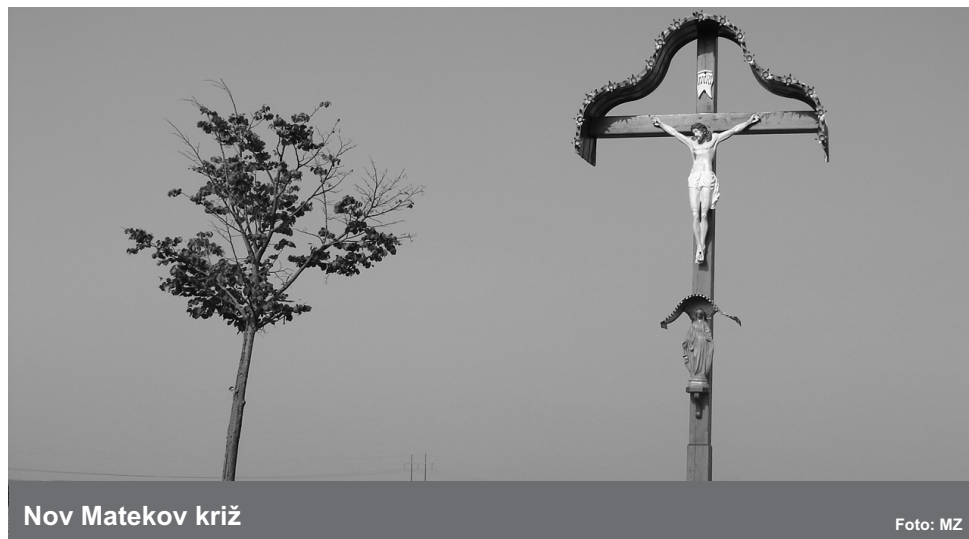
Nov Matekov križ