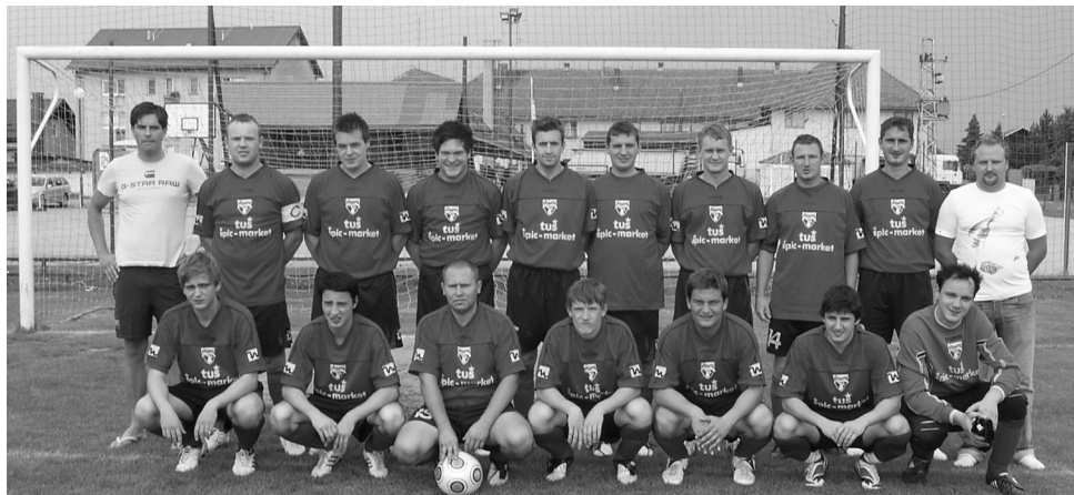
Članska ekipa NK Markovci