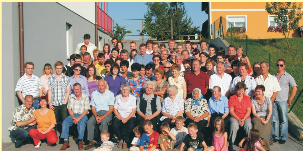
Zbrani na srečanju "Melačove žlahte"

Glede na to, da se z nekaterimi sorodniki res že dolgo nismo videli, smo organizatorji srečanja z negotovostjo čakali sobotno popoldne. A skrb je bila odveč; sorodniki so pričeli prihajati in nazadnje se nas je zbralo več kot 90. Najstarejša sorodnica je imela 84 let, najmlajši sorodnik pa dve leti. Kar nekaj nas je bilo, ki smo se prvič v življenju videli