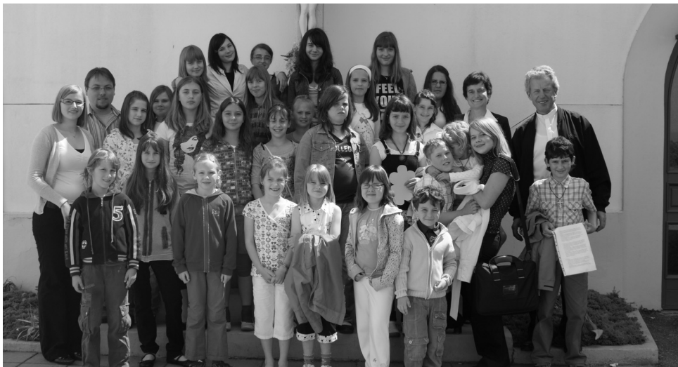
"Zvončki" s svojimi gosti v mesecu maju