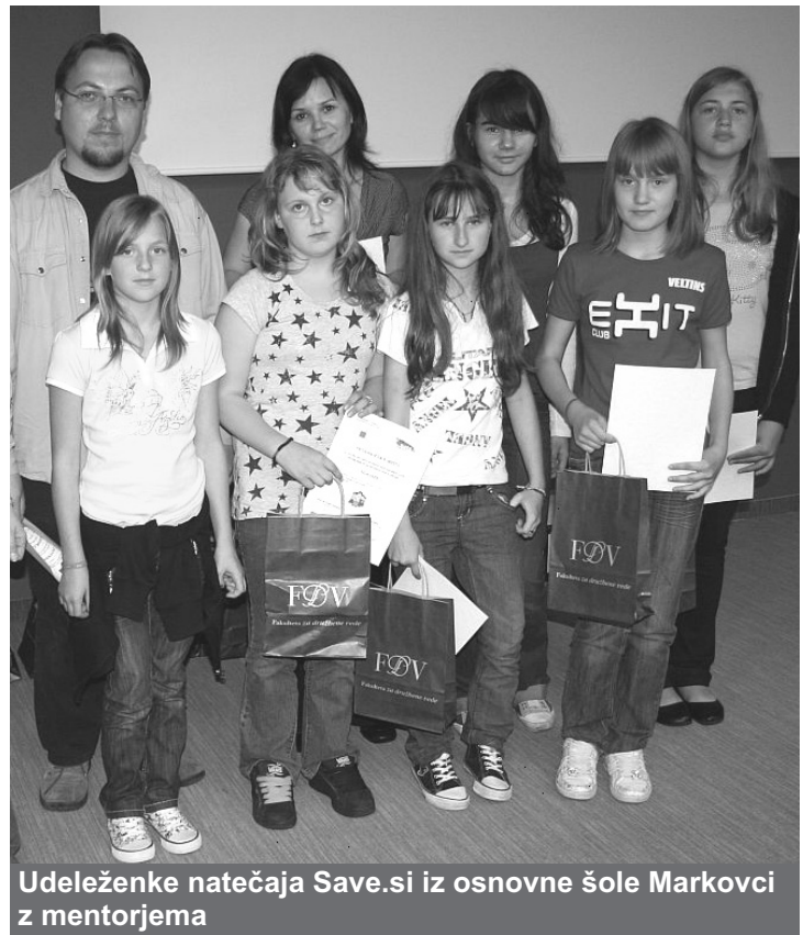
Udeleženke natečaja Save.si iz osnovne šole Markovci z mentorjema