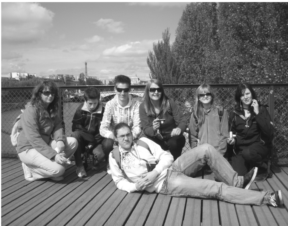
Učenci OŠ Markovci so se letos odpravili na zanimiv izlet v Pariz in Bruselj.