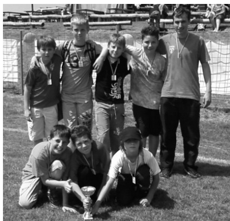
Ekipa mlajših dečkov na turnirju v Dornavi