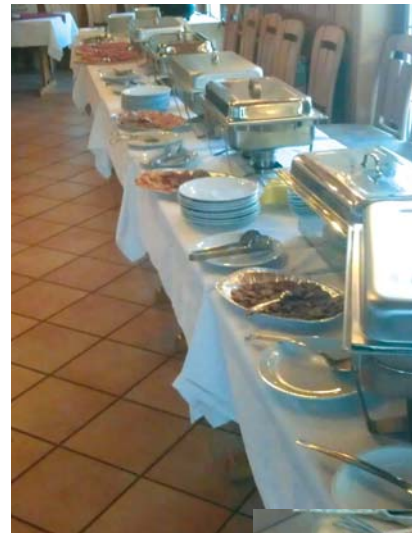
Dolga vrsta pripravljenih toplih jedil in subhomesnatih izdelkov

V ponedeljek, 10. decembra 2012 je na Turistični kmetiji Hudičevcevec potekala že tradicionalna prireditev Dan kolin , ki jo organizirajo člani Društva za gostinstvo in turizem v katerega so vključeni tudi člani naše Sekcije za gostinstvo in turizem. Fotografiji sta iz zasebnega arhiva.