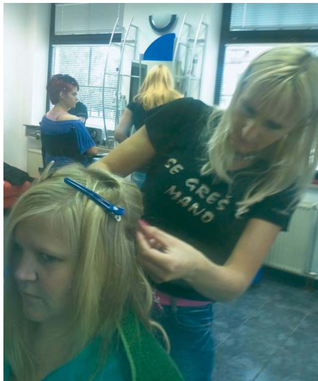
Pramene je treba pregledati z vseh strani

Mirno lahko rečem, da nam šolstvo daje veliko premalo šolan kader. Problematiko poznam od blizu, ker sem že vsa leta tudi članica sekcije frizerjev pri OZS, in da se že leta spopadamo s tem problemom. Učenci bi izkušnje morali pridobivati v salonih, saj samo neposredni stik z delom in strankami res prinese