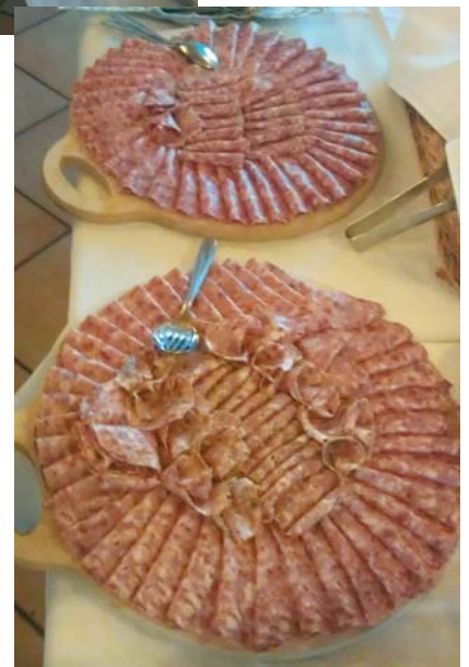
Če je še tudi dobro tako kot je vabljivo na pogled, potem le k mizi!

Na internetni strani Občine Postojna www.postojna.si si lahko preberete članek Tradicionalno srečanje OOZ Postojna, kjer so objavljene tudi fotografije.