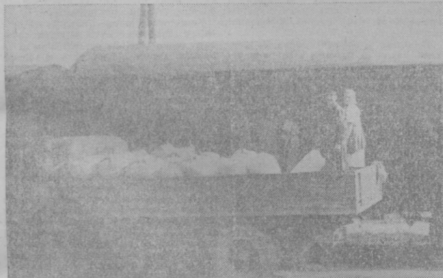
Vagonske pošiljke za industrijske centre

Pod Upravo okrajnih mlinov Ptuj spada dva mlinska obrata št. 1 in mlin št. 2. Storilnost teh dveh obratov zadošča, da se krijejo potrebe po mlevskih izdelkih za mesto Ptuj, najširšo okolico kakor tudi, ako je potreba, za druge okraje po Sloveniji.