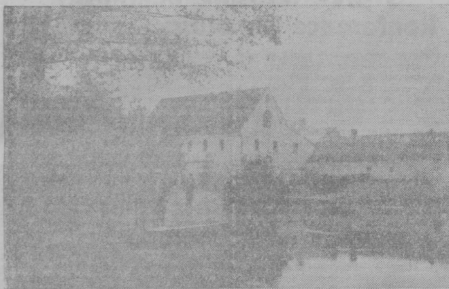
Okrajni mlin na Sp. Bregu