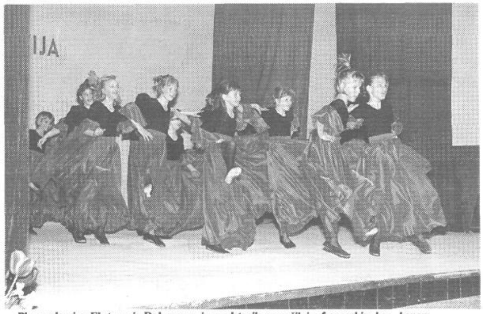
Plesna skupina Ekstrem iz Dobrove se je predstavila z značilnim francoskim kan. kanom.