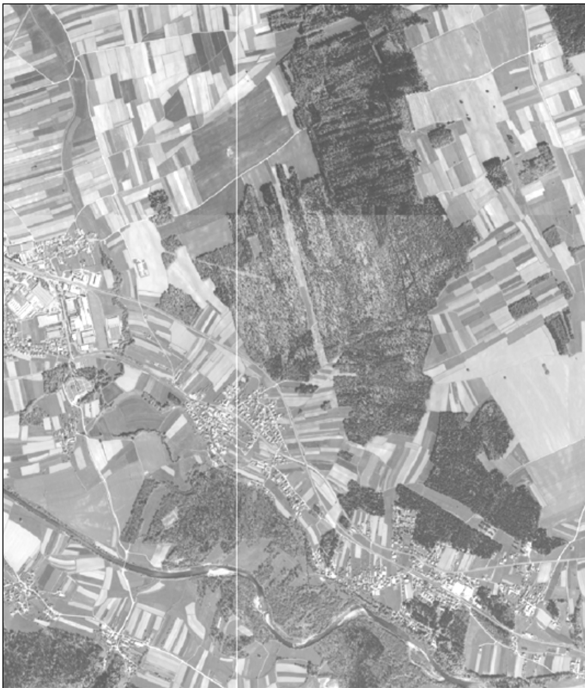
Južni del Sorškega polja z Godešičem in Ratečami (GURS 2000, DOF 5: D 24-08, D 24-09, D 25-48 in D 25-49).