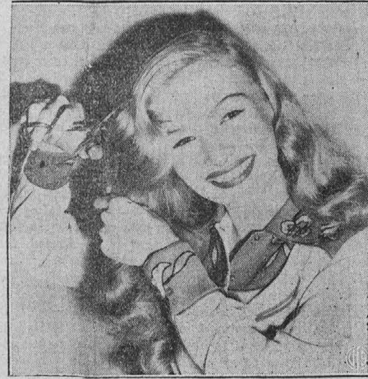
Bi kupili lepe lase? Tukaj imate lepo priliko, da jih kupite "prav po zmerni ceni." Filmska igralka Veronika Lake je ponudila svoje lepe kodre za $5,000,000, kar bo dala potem za vojne bonde. Nekdo jih je kupil za en palec dolžine in je plačal $180,000.

Vedeti morate, da svoje gazolinske knjižice ne morete dati nikomur, tudi če prodaste avto. Ako avto prodaste, ali če ne vozite več z njim, morate v teku 5 dni vrniti knjižico odboru za racioniranje. Ako pa kupite nov avto, morate napraviti pri tem odboru prošnjo za gazolinsko knjižico. Ako vam slučajno zmanjka gazolina kje na potu, ga dobite na bližnji gazolinski postaji, toda tam morate pustiti svojo gazolinsko knjižico, dokler ne pridete z avtom na postajo. Ako potrebujete gazolin v skrajni sili, kjer bi bilo v nevarnosti življenje, zdravje ali lastnina, dobite gazolin od prodajalca, toda podpisati morate posebno listino, ki jo je izdal urad za kontrolo cen nalašč v take namene. Tisti, ki imajo gazolinsko knjižico "A," morajo vrniti vse kupone, ki jih niso porabili do datuma, kot določeno za posamezne kupone. Vrniti jih morajo 5 dni potem, ko se njih veljavnost izteče odboru za racioniranje.