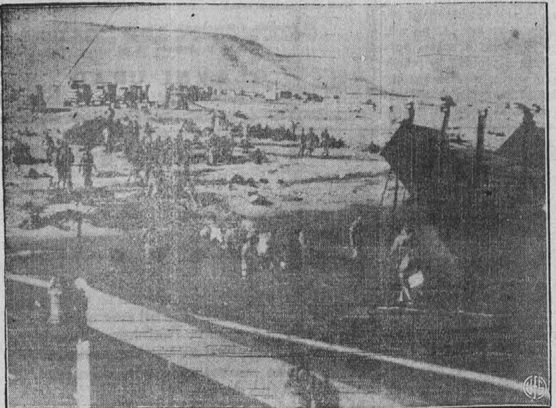
Voda za vojake. — V puščavi Severne Afrike, kjer je sedaj naše vojaštvo, je veliko pomanjkanje pitne vode in zato jo morajo za vojaštvo dovažati z ladjami. Na sliki vidimo eno takih ladij, ki je pripeljala tisoče sodov sveže pitne vode.

Ime in priimek ..... Služi pri: U. S. Army ..... Navy ..... Marines ..... Coast Guard ..... Air Corps ..... Merchant Marine..... Ime in priimek dekleta ..... Služi kot: Nurse ..... WAAC ..... WAVE ..... Ime in naslov staršev ali sorodnikov ..... OPOMBA: Pišite imena razločno. Ni treba pisati vsega vojakovega naslova, ker se njih naslovi vedno spreminjajo. Zaznamujte samo vojaško enico, pri kateri služi, s tem, da napišete v določeni vrsti besedo "da," ali pa samo črkajte z navadno navpično črto. Izrežite ta kupon in ga pošljite takoj ali najkasneje do 10. decembra na: Ameriška Domovina, 6117 St. Clair Ave., Cleveland, O.