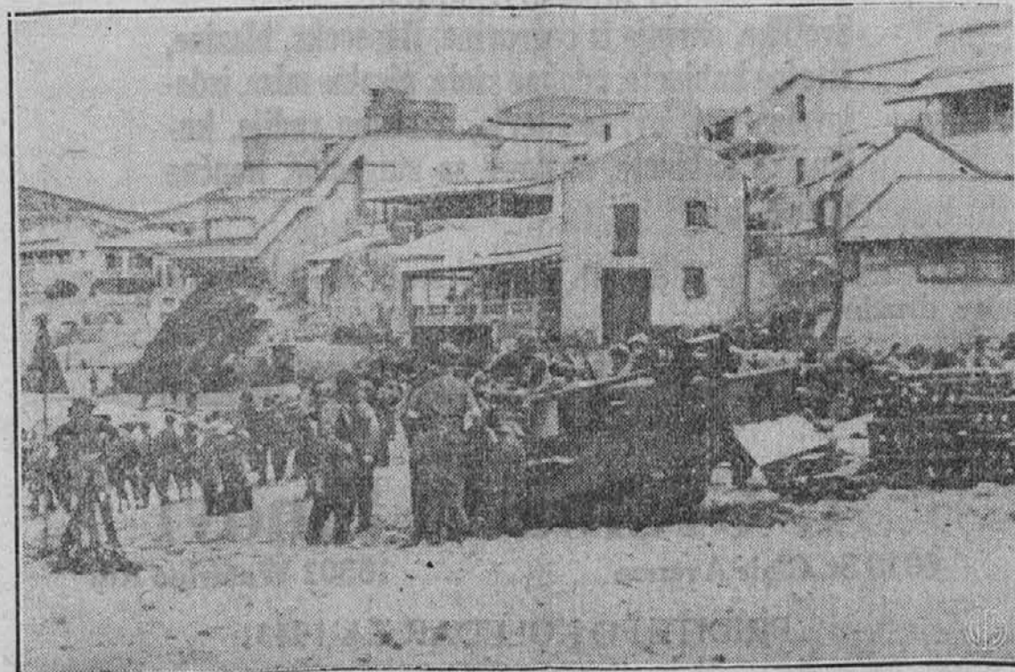
Gornja slika nam predstavlja ameriške vojake, ki so dospeli v Afriko. Slika je bila posneta na afriški obali v bližini Orana v Alžiriji.