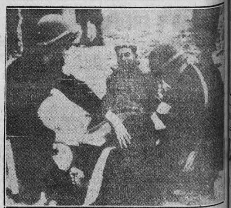
Gornja slika nam predstavlja dva ameriška vojaka, ki prijateljsko obvezujeta ranjenega francoskega vojaka na afriški fronti, kamor so dospeli zavezniške čete. Tu se se nekoč vršili krvavi boji.

(Dalje prihodnjic) Zed. države so plačale za otroke Filipinov $20,000,000.