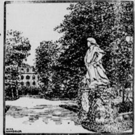
Kje je paznik parka?