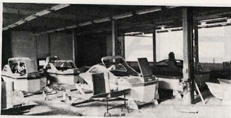
Montažna hala čolnov

Delovna organizacija je organizirana skupina. Zato je v sociološkem pogledu kohezivna, strukturirana in gibljiva družbena forma množice ljudi, ki se zaradi svojih potreb in potreb družbe udeležujejo določene dejavnosti, stopajo pri tem v določene medsebojne odnose in ustvarjajo elemente skupne kulture. Sociološka opredelitev opozarja zlasti na elemente kohezivnosti, dinamičnosti in problematiko odnosov. Napáčno bi bilo obravnavati delovno organizacijo zgolj z vidika gospodarske dejavnosti, poudarjati izključno dohodek in pri tem zane-marjati druge socialne elemente. Prav tako je treba odklanjati napáčno pojmovanje družbene lastnine, ki so jo nekateri šteli za kolektivno. Delovno organizacijo je tre-