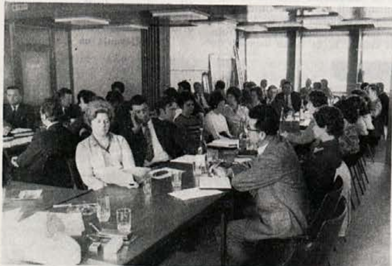
Letos so se finančni strokovnjaki lesnih podjetij Slovenije zbrali na simpoziju v Elanu, govorili so o gospodarstvu