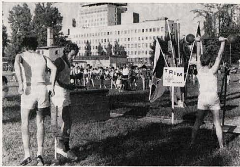
TRIM — TRIM — TRIM — TRIM — TRIM — TRIM — TRIM — TRIM —