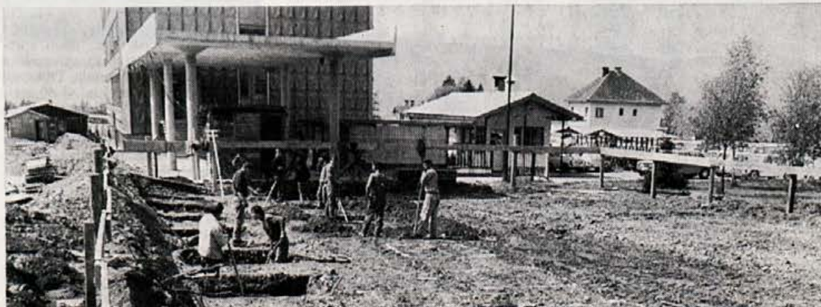
Začetek gradnje industrijskega skladišča »Elan« Begunje