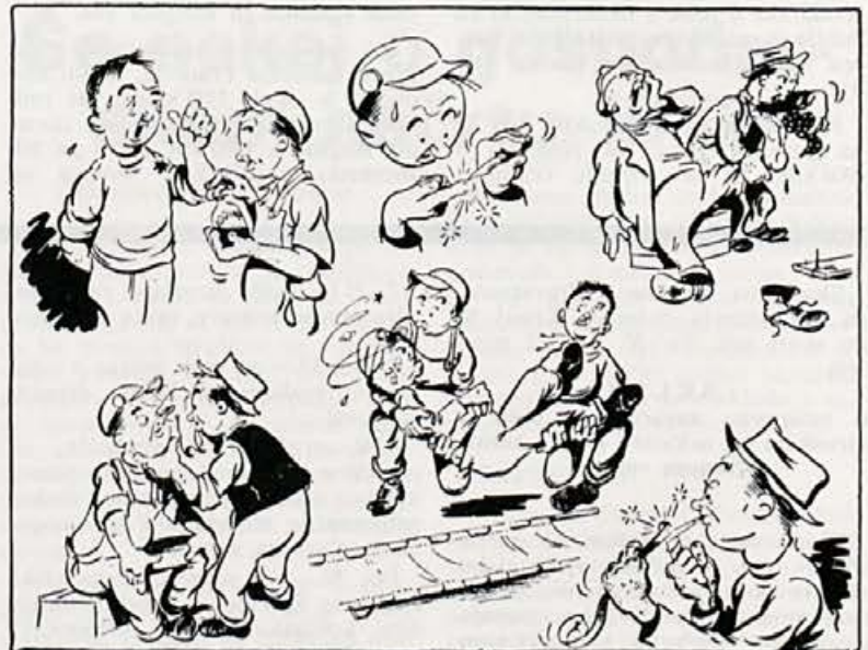
Prva pomoč naj bo »strokovna«