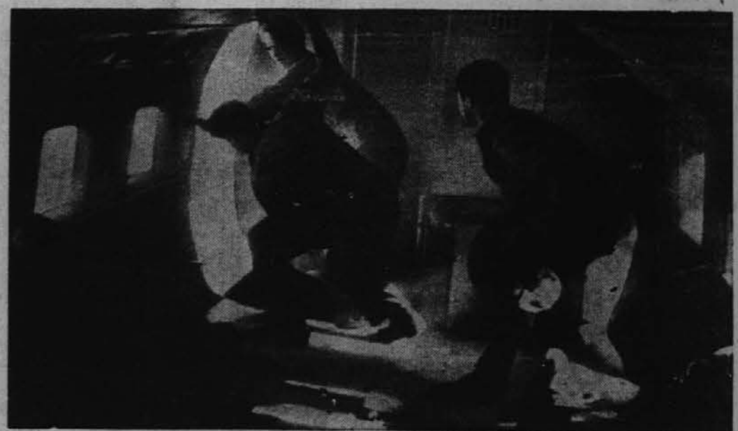
Zavezniški letalci mečejo iz transportnih a eroplanov vojaške potrebščine vojaškim posadkam na Novi Guineji.