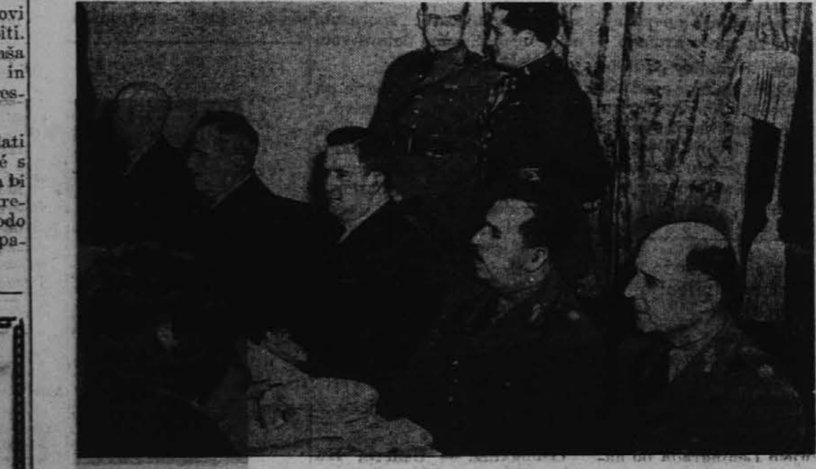
S sedanjim mehiškim predsednikom Camachom so pri kosilu štirje bivši mehiški predsedniki, kar kaže edinstvo v sosedni republiki.