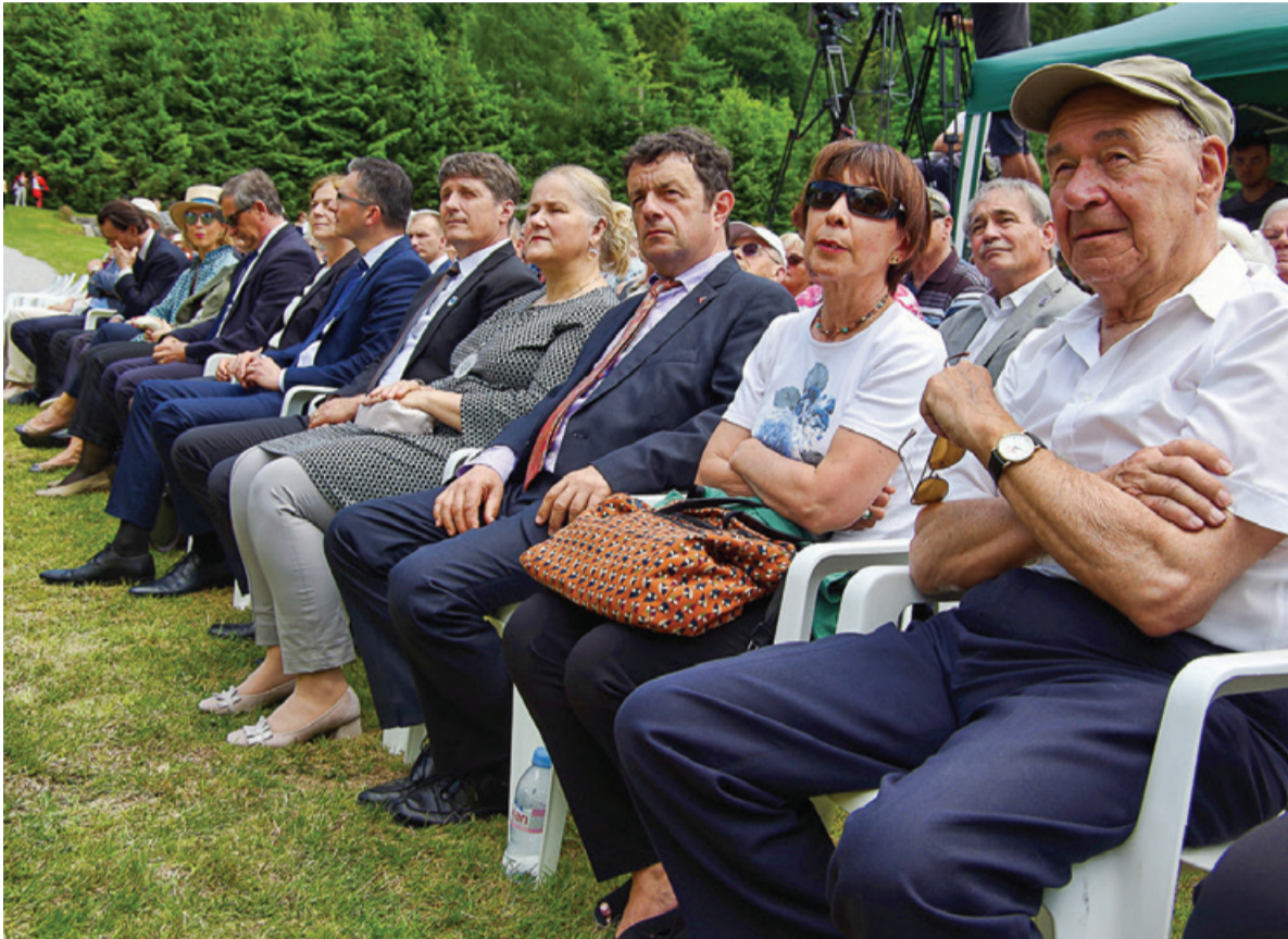
Pred spomenik Obtožujem je venec položila tudi delegacija ZZB NOB Slovenije.

mo. Niso bili vsi enaki. Samo žal so tisti, ki so mislili drugače, bili preveč kulturni, preveč miroljubni in premalo agresivni, da bi se lahko uprli norim idejam, ki so jih takrat preplavile. Tudi v teh državah je bil odpor in zato smo danes še toliko bolj veseli, da imamo goste iz vseh teh držav. Kajti niso narodi krivi, kriva je politika, ki ne ve, kako bi