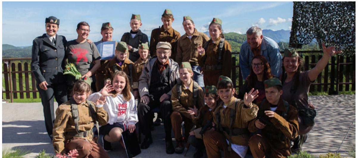
Udeleženci pohoda spomina in tovarištva Kavče 2019

Vse to smo občutili na poti, ko so nam bili zaigrani trije različni vojni prizori: padec partizanskih kurirjev v nemško zasedo na zabrskih travnikih in rešitev pošte, tiha kolona ranjencev v partizansko bolnico Jelka Breza, kjer smo lani slovesno postavili tablo, in pogumno dejanje zavednega kmečkega de-