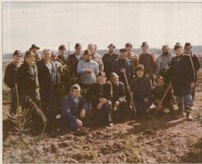
Ob koncu še skupinski posnetek

dobili varovalno oazo za divjad. Člani društva obdelujejo tudi 5 hektarjev njiv, na katerih pridelujejo pridelke za zimsko krmljenje. Člani omenjenega društva zdaj največjo skrb pos-