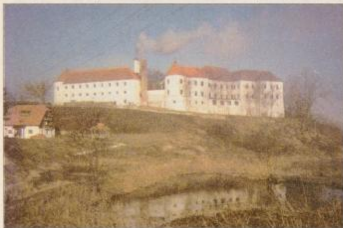
Mogočno grajsko poslopje Hrastovca skriva tisočero usod.

PTUJ / ZAČETEK SANACIJE TRAVNIKA V LJUDSKEM VRTU