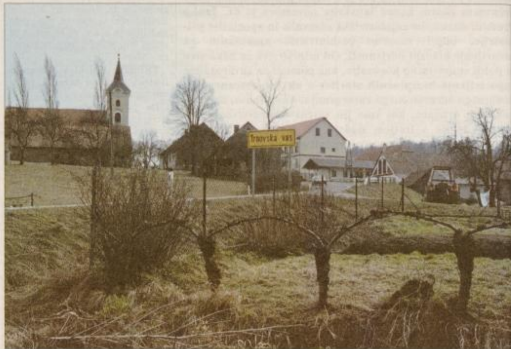
Panoramski pogled na Trnovsko vas. Morda bodo nekaj barvne svežine kraju prinesle novogradnje