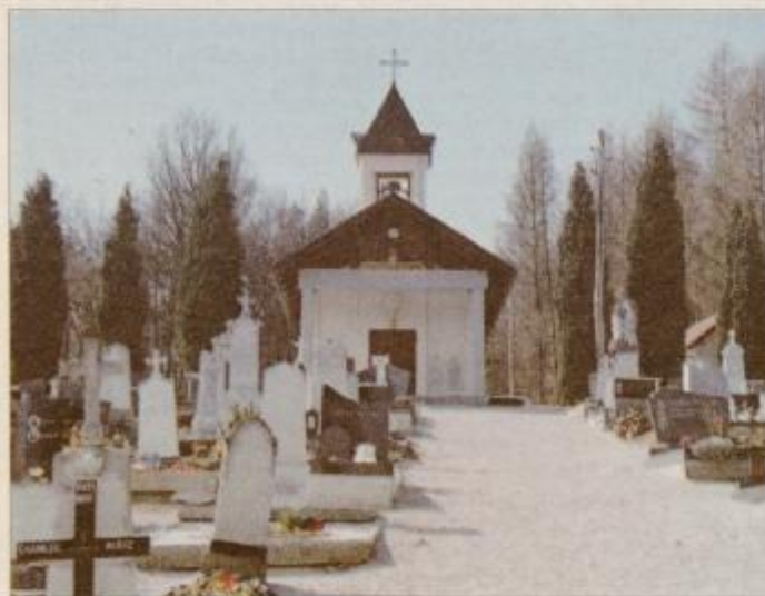
Kapela in mrliška vežica je bila prek kratkim obnovljena