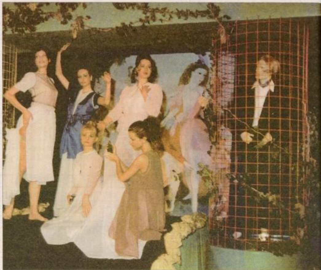
Z modne revije Mercatorja.