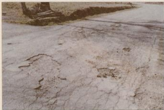
Cesta proti Vitomarcem je precej luknjasta

Trnovsko vas z bližnjo okolico smo po opisanih merilih ocenili z oceno 5,5.