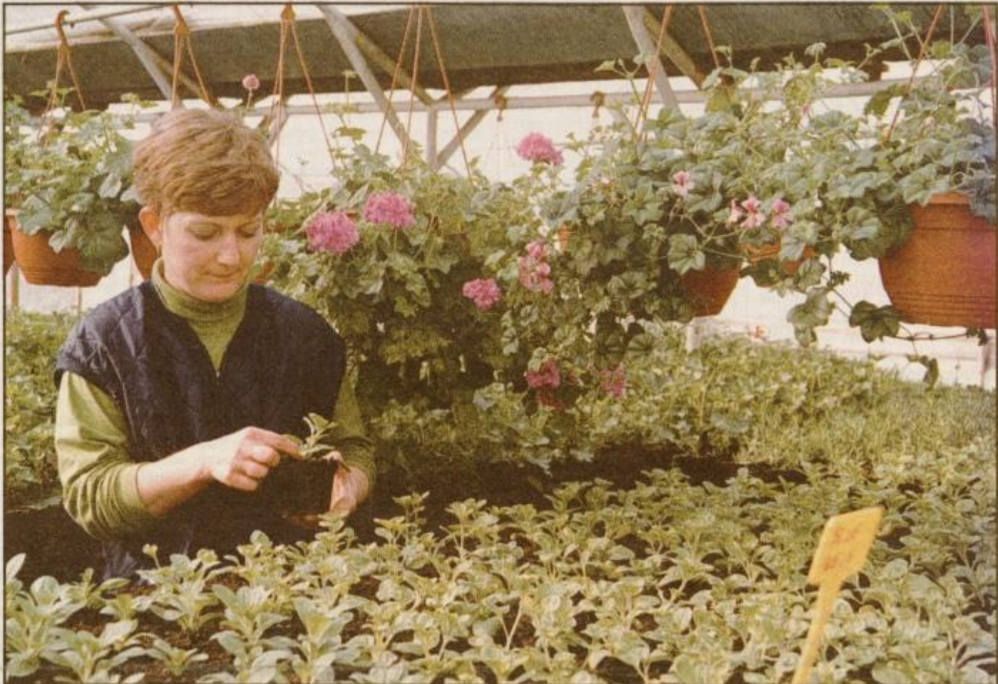
Na pomlad se pripravljajo tudi v vrtnariji Požarjevih v Lancovi vasi.