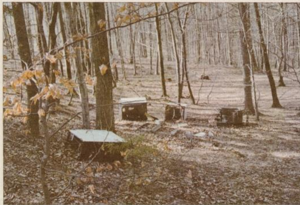
Neprijeten prizor v gozdu ob cesti na Bišečki Vrh

vasi nimamo otroškega vrtca in osemletke. Menim, da se s pridobitvijo občinskega središča zadeve niso bistveno spremenile na bolje. Srečni pa smo, da imamo v Trnovski vasi nov zdravstveni dom, zdravnika in zobozdravnika."