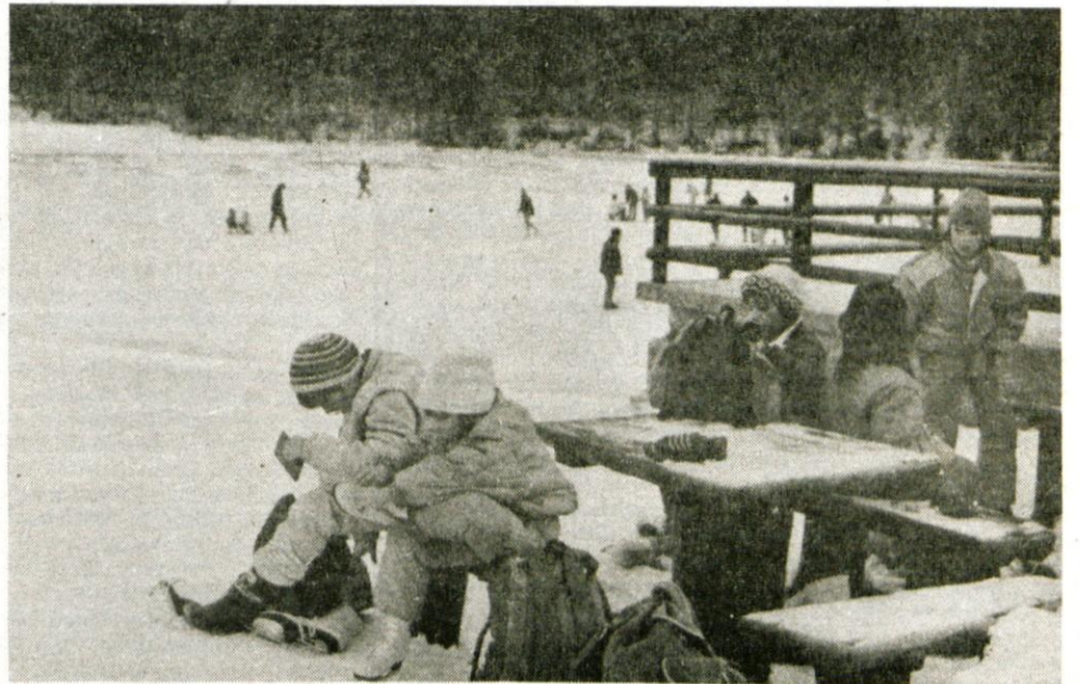
Jezersko, 26. januarja - Planšarsko jezero nad Jezerskim v teh dneh ne sameva, saj njegova zaledenela površina privlači številne drsalce in druge ljubitelje zimskega veselja. Tak vrvež mladih in starejših na jezeru je bil tudi to soboto. Najmlajši počitnic nimajo in so tudi te dni v vrtcu. Posnetek je iz tržiškega Palčka.

Tok sedanje negotovosti se ponekod že usmerja na tisto kolo, ki umirja navajeno vztrajnost za delo, pripravljenost, akcije, reševanje problemov v krajih. Takšno (ne)načrtno zavlačevanje ali pa odlašanje z oblikovanimi opredelitvami, mnenji in možnimi rešitvami vzbuja med ljudmi (vodstvi in krajani) v krajevnih skupnostih vsaj dve vrsti zaključevanj: ali se gremo skrivalnice, da bi, ko bo napačil pravi trenutek, lažje na hitro "naredili" tako, kot se zdi zdaj načrtovalcem prav; ali pa smo priča nemoči in oceni, da nekdanje nepovedi o racionalnosti in ekonomičnosti niso ravno najbolj enostavne... ● A. Žalar