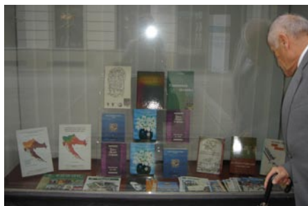
Razstava dela slovenskega tiska na Hrvaškem, izložba Mohorjeve družbe.