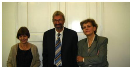
polna.