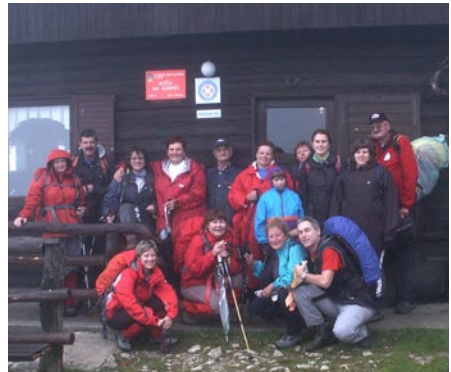
Pred Kočo na Dobrči.