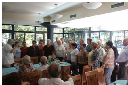
Pevci na druženju.