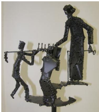
Trubar Aleksander Arhar, skulptura Vsem Slovincem