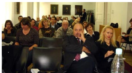
Dvorana Slovenske matice je bila skoraj