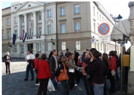
Na Markovemu trgu.

domov vrnili navdušeni in z mislijo, da so takšna druženja in izleti vseh skupin in vseh generacij društev izredno pomembna tudi za usklajeno delovanje našega društva.