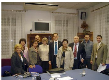
EU delavnica na Reki.