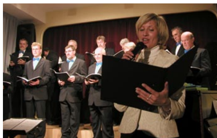
MoPZ Lira, Kamnik.

slovensko pevsko društvo je ostalo zvesto gojenju pesmi, še posebno slovenske ljudske pesmi, ki so jo pevci Lire, tako kot tudi ime Slovenije in Kamnika, ponesli daleč čez državne meje. Sodelovali so na različnih festivalih in tekmovanjih v Sloveniji in po Evropi. V svoji bogati zgodovini so dosegli številna mednarodna priznanja na področju moškega zborovskega petja.